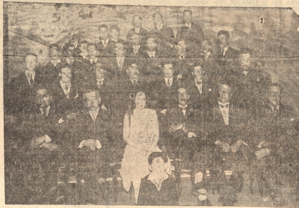
LOS PROFESORES QUE INTEGRAN LA ORQUESTA SINFONICA, POSAN PARA "LA PATRIA"