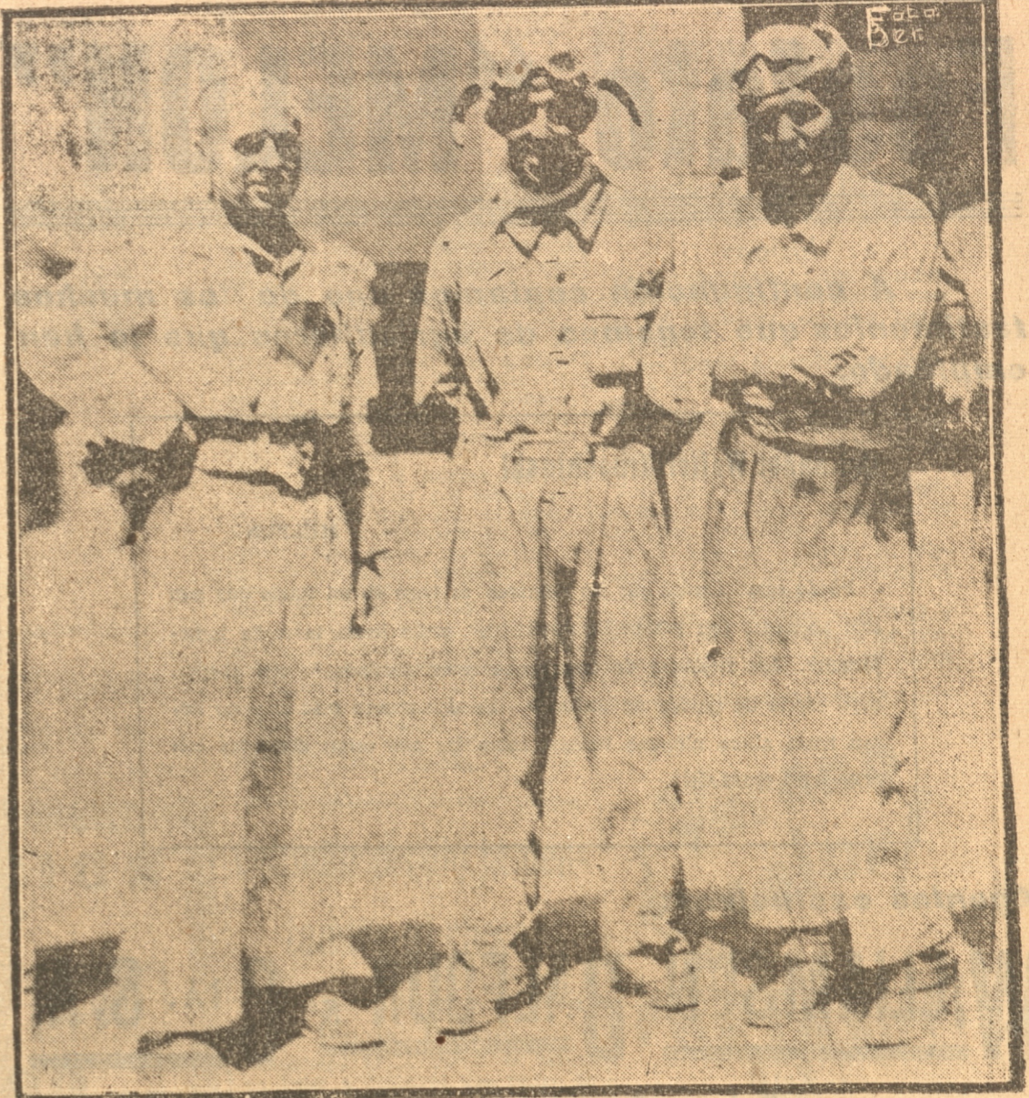
Los tres primeros vencedores de la prueba nosan para "La Patria"

Esta fueron las declaraciones del distinguido ganador de la magna carrera.