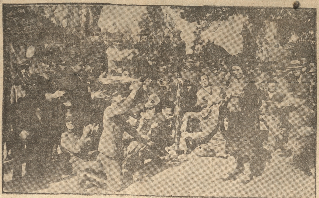
FOTO VENEGAS SORPRENDIO ESTA INSTANTANEA QUE REVELA LA ANIMACION EN QUE SE DESARROLLO LA FIESTA