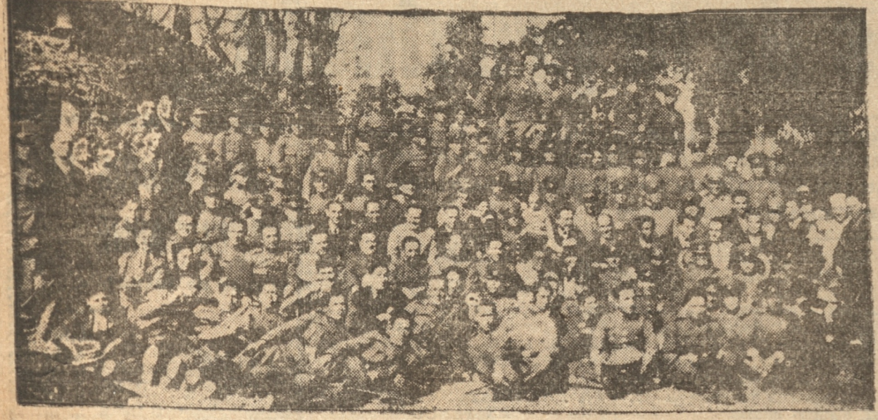
GRUPO GENERAL DE LOS ASISTENTES A LA MANIFESTACION