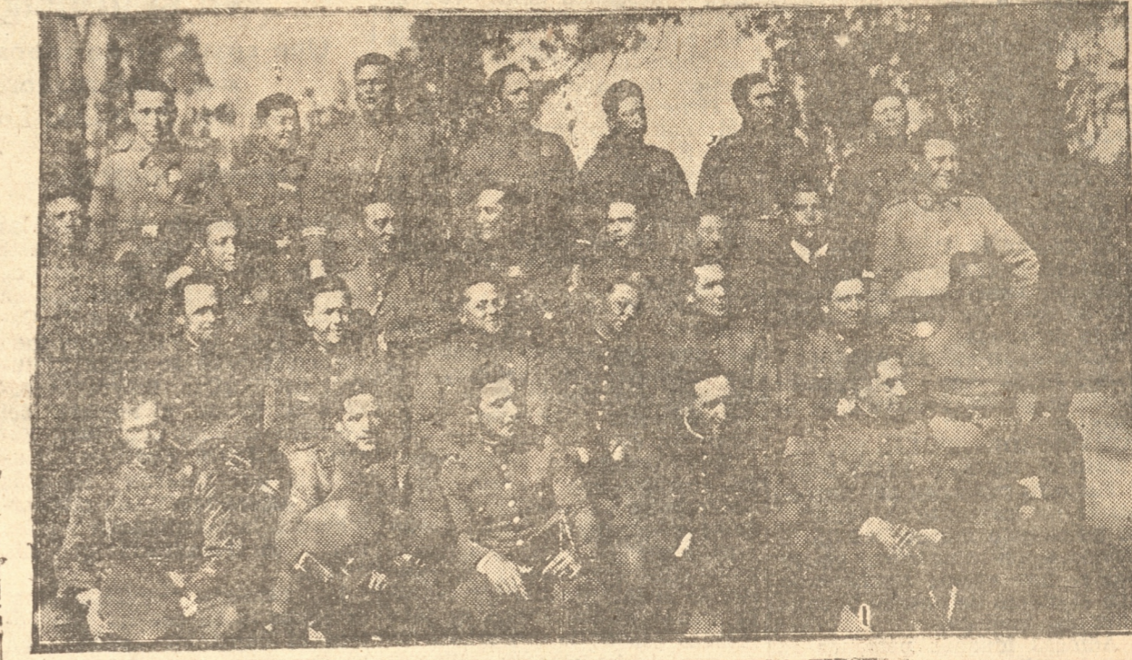
JEFES, OFICIALES Y SUBOFICIALES ASISTENTES A LA FIESTA

me a su defensa, sabremos dejar el cariño de nuestros padres, esposas e hijos, y correremos a defenderla. Aquí tenéis, señores, expresados en pocas palabras, nuestros sentimientos. Cuando soliciten nuestra cooperación en el nombre del "Orden y de la Patria", encontrarán en nosotros sus fieles cooperadores.