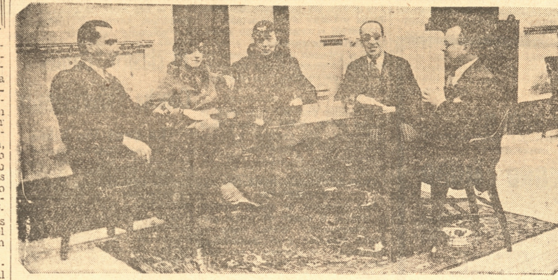
Una de las mesas en el Aperitivo de ayer en el Club Concepción.