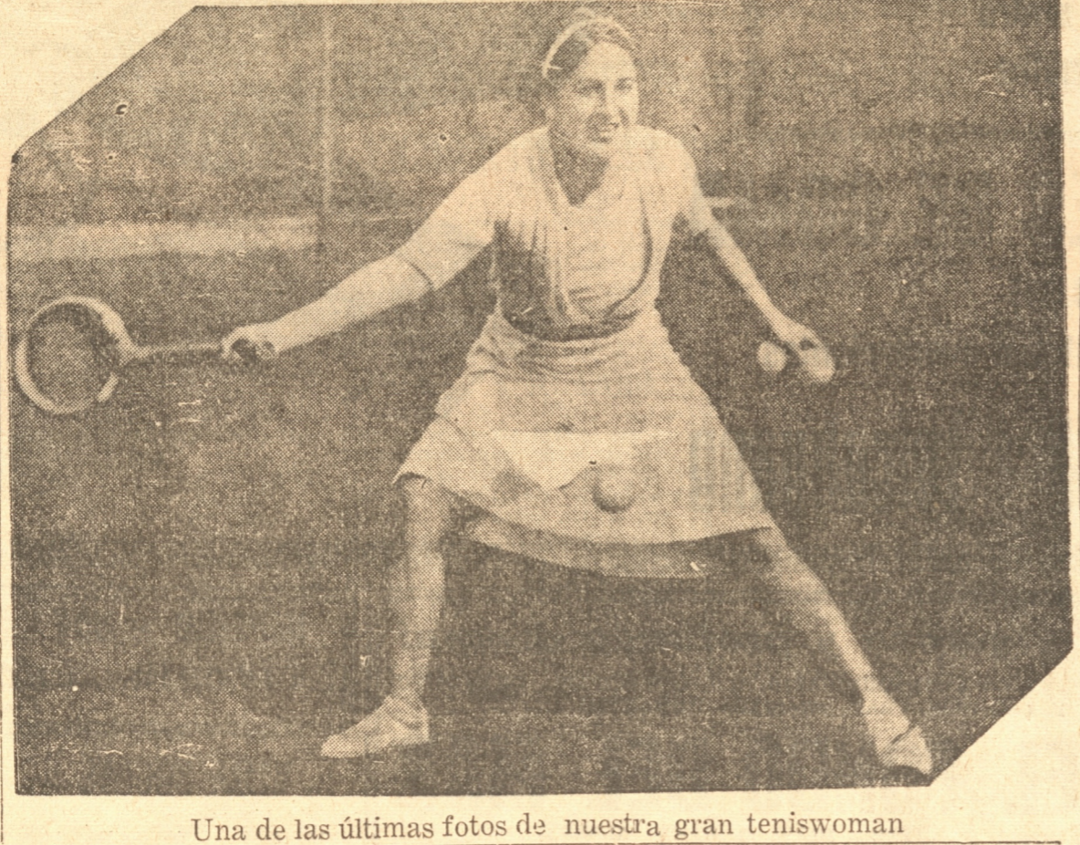
Una de las últimas fotos de nuestra gran tenismoman