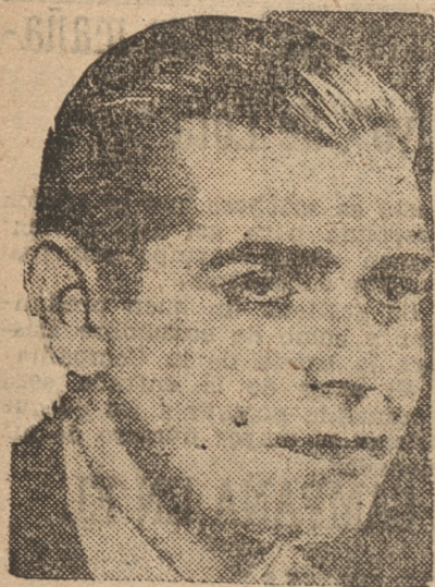
LA MAS ALTA CONCEPCION DRAMATICA DEL GRAN

OFICINA DE INFORMACIONES Calle Bulnes 196 — Teléfono 115