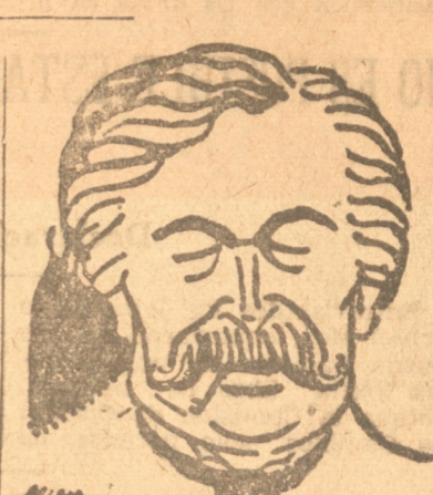
M. ARISTIDE BRIAND

PARIS, 28. — (UP). — El traslado de los restos del estadista M. Aristides Briand, desde el cementerio de Passy a Cocherel, se efectuará el día tres de julio a las 10.30 horas.