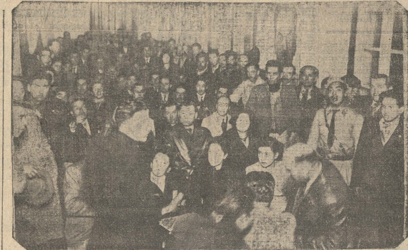
ASISTENTES A LA CONCENTRACION SOCIALISTA DE ANOCHE EN EL LOCAL DE MAIPU 443

RECHAJE Se hará en cada Barrio bajo la responsabilidad de los di-