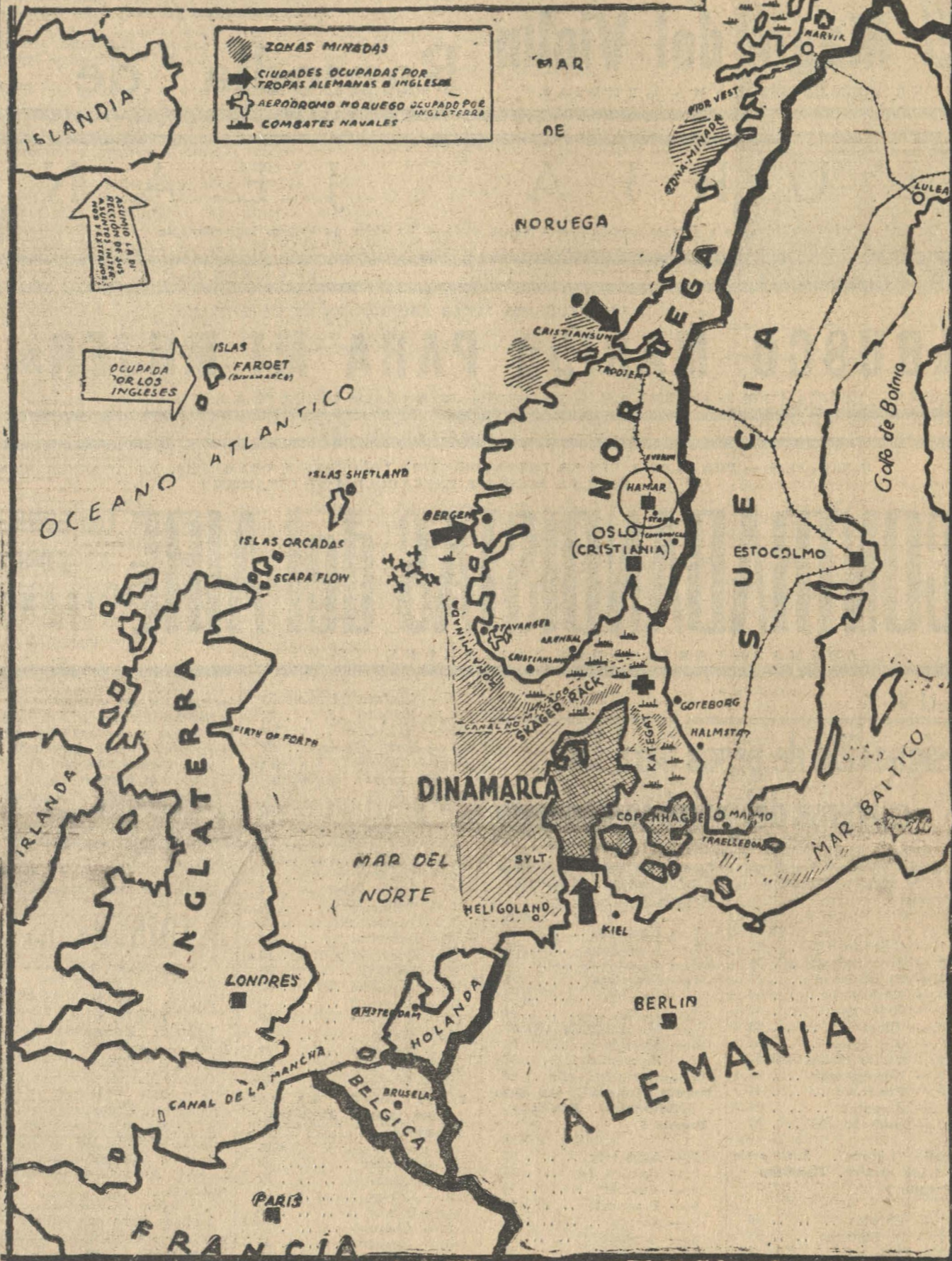
Por este magnífico mapa de Noruega, la tierra Escandinavia hacia la cual inesperadamente hace pocas semanas se trasladó la guerra, puede el lector darse cuenta de los sitios donde se efectúan las operaciones actuales del conflicto europeo.