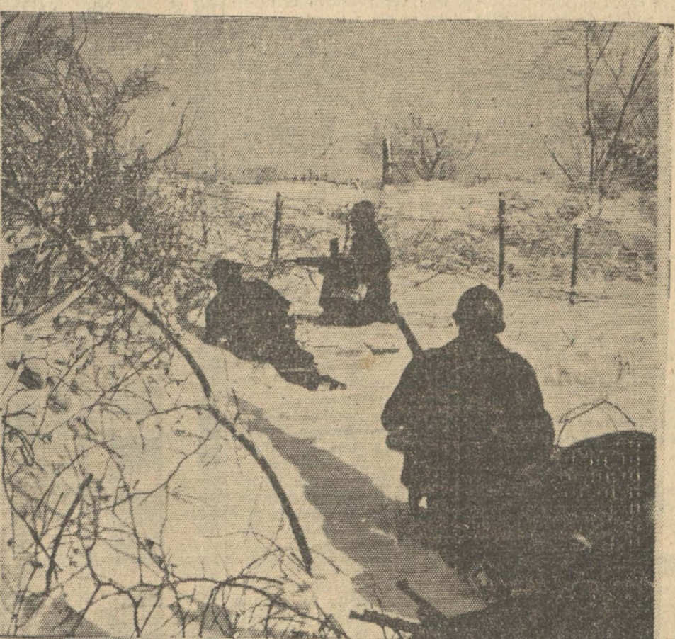
La actividad de las patrullas es intensa, algunos días en el frente occidental. Aparecen en la foto soldados franceses, en un avance por las líneas enemigas, armados de fusiles-antitancos. Se arrastran por la tierra donde el invierno señala toda su crudeza

Qual Dorsay ayer y se reunieron los representantes de los países aliados desde las 8.15 hasta las 5.30 P. M. y hoy martes desde las 9.30 hasta la 1 P. M. La presencia de los representantes británicos en París se mantuvo en el más estricto secreto. Lord Halifax vino hoy en avión y concurrió a las conversaciones trayendo los últimos despachos oficiales que hablan cuenta del progreso de los aliados en Noruega.