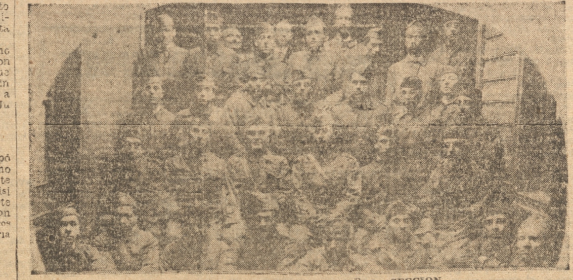
GRUPO DE MILICIANOS DE LA PRIMERA SECCION

Artillero de Costa venció a San Vicente por amplio margen de puntos Ante escaso público se efectuaron en la tarde de ayer los partidos oficiales programados por la Asociación local comen-