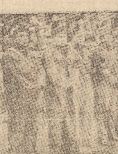
EL ESTADO MAJOR PROVINCIAL E INVITADOS PRESENCIANDO LA REVISTA

de su verdad no persigue otro objeto que coartar sus más elementales libertades, reemplazándolas por nuevas oligarquías, despóticas y despiadadas. Entre nosotros, el fenómeno de estas tendencias comunistas está a cargo de cabecillas que explotan la credulidad de nuestro pueblo, que ni siquiera pertenecen a él y que sólo persiguen labrar un pedestal de fácil aureola popular, al amparo de las seguridades que les otorgan nuestras garantías constitucionales.