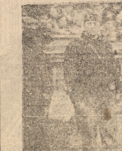
EL ESTADO MAJOR PROVINCIAL E INVITADOS PRESENCIANDO LA REVISTA

No quiero terminar sin otorgar nuestras públicas agradecimientos a los distinguidos jefes y oficiales de Carabineros de Chile, que nos honran con su presencia. Esta institución armada, aunque tiene antecedentes que provienen desde que Chile