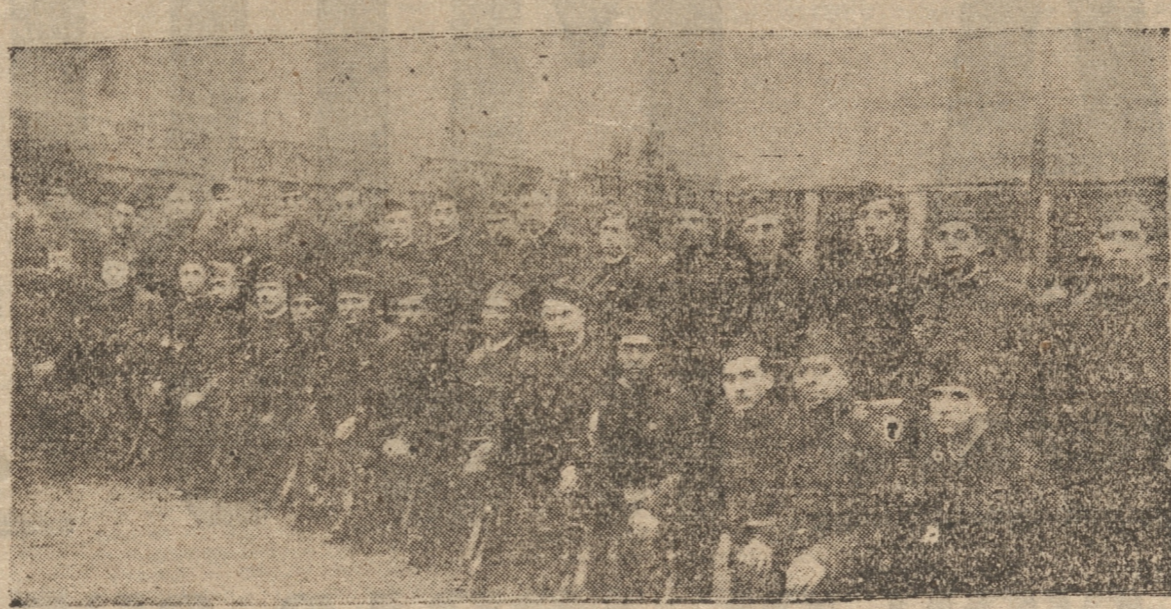
UN PELOTON DEL REGIMIENTO MOVILIZABLE EN LA LINEA DE TIRADORES