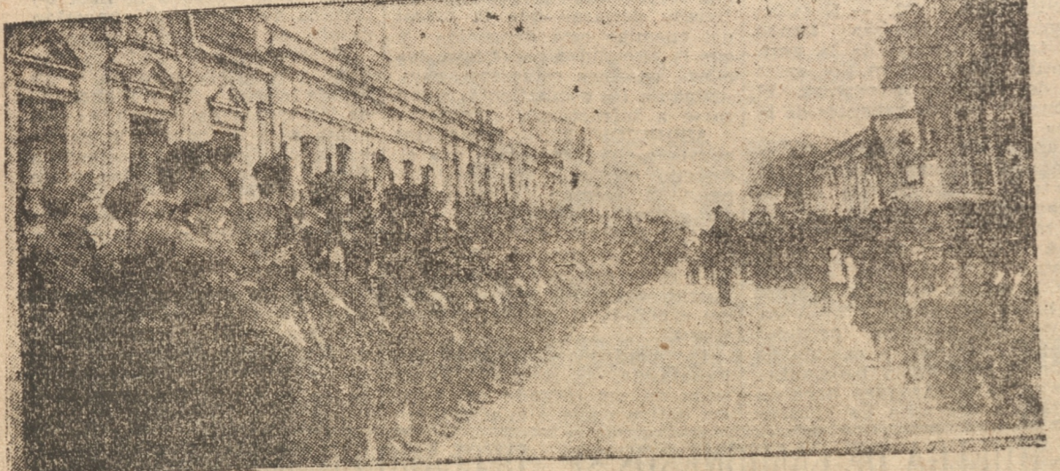
AL IZAR EL PABELLON NACIONAL EN EL FRONTER DEL CUARTEL