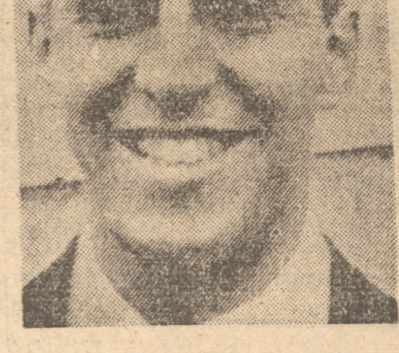
NEGRO MUSCZ, jugará esta noche por el cuadro de Universitario

En el preliminar, de intermedia, actuaron Liceo e YMCA. Programa oficial Es el siguiente: A las 21.15 horas: Liceo con Asoc. Cristiana, División Intermedia. Arbitro señor Venegas. A las 22 horas: Universitario con Italiano, División de honor. Arbitro señor Vilches. Director de partidos, señor Fahrenkrog. De boletería señor Diebelbach. Comisarios: Cochrane, Español, Lynch y Alaman.