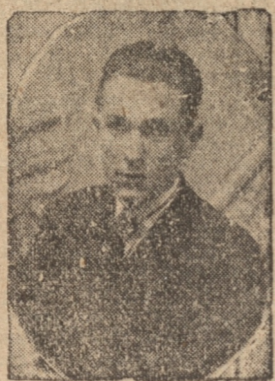
El mejor goleador local

En realidad que Lord actuaba desacompañado, pero así y todo, jugaba más peligrosamente en el campo adversario. La valla de Asstete se vio acedida continuamente, pero esto meta salió airoso en varias intervenciones difíciles y en otras, la valla se escapó, con tiros