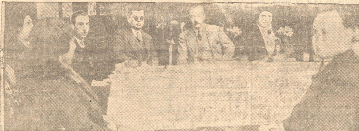
UN ASPECTO DE LA MESA DE HONOR

Si nos fuera dado extendernos tras miras por la provincia en-