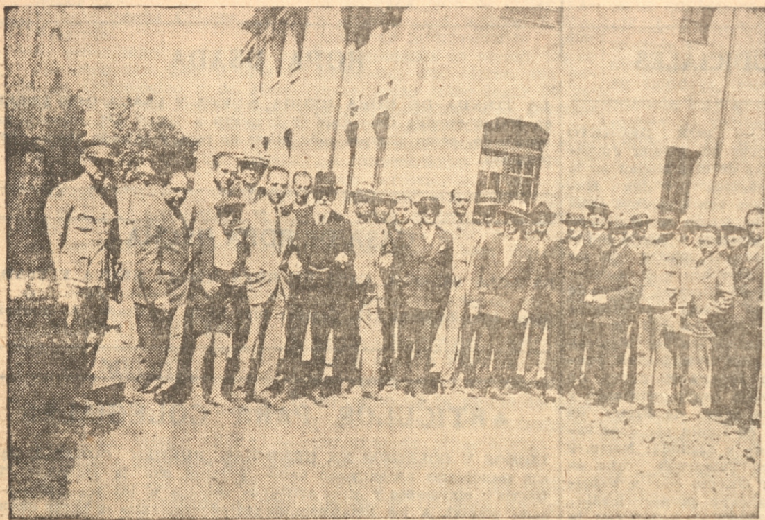
DURANTE LAS VISITAS A LAS DIFERENTES CONSTRUCCIONES