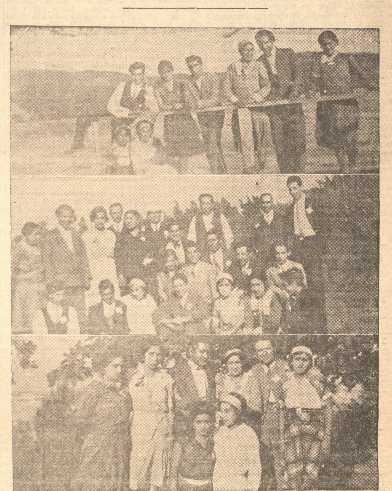
DIVERSOS ASPECTOS DEL PA SEO QUE EFECTUO AYER A SAN PEDRO "LA UNION GRAFICA" CON MOTIVO DE CELEBRAR SU SEXTO ANIVERSARIO