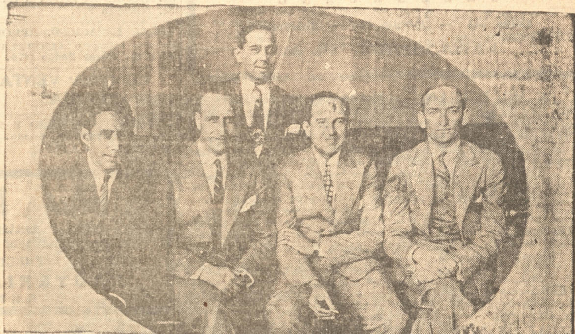
LOS CONSTRUCTORES Y LA COMISION QUE SE RECIBIO DE LAS OBRAS