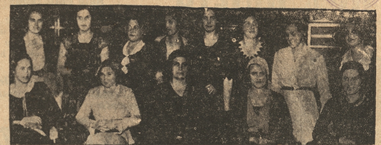
ASISTENTES A LA MANIFESTACION UN GRUPO DE SUS RELACIONES OFRECIO AYER A LAS SEÑORITAS RIGO-RIGHI TON OLLI

Bueno es amar la virtud, pero mejor es practicarla. HOY San Pedro Cris. MANANA San Dalmaciano