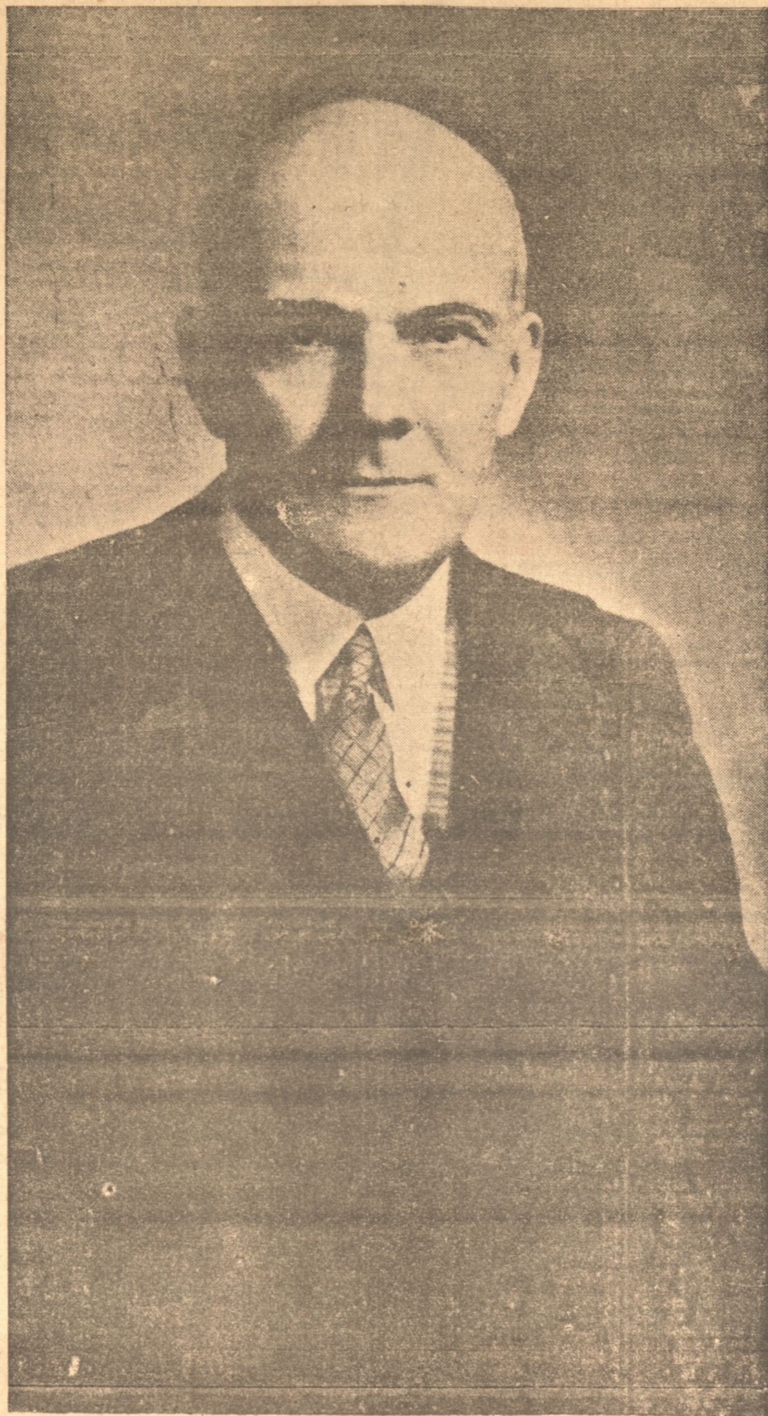
DON GUSTAVO ROSS SANTA MARIA, candidato nacional por el cual votarán hoy en el país, los conservadores, liberales, demócratas, agrarios, radicales doctrinarios, la Acción Republicana y los elementos independientes de la producción y del comercio

Por su parte, el candidato del Frente Popular, cuenta con el apoyo del