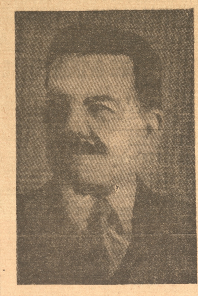
Don Pedro Aguirre Cerda, candidato del Frente Popular, por el cual votarán hoy el grueso del Partido Radical, los comunistas, socialistas y democráticos

De todo el país sale una sola exclamación: ¡ROSS! La situación general es de unánime consenso para darle el triunfo a este candidato. LA SITUACION POLITICA DE LAS PROVINCIAS DE CONCEPCION Y ARAUCO Lo que acabamos de decir, es lo referente al panorama general del país; la situación en las provincias de Concepción y Arauco, en detalle, según los datos recogidos en las secretarías de ambos bandos, y las informaciones hechas por cuenta periodística, es mas o menos como sigue: Hacen unos 20 días, se creía en el triunfo del señor Aguirre Cerda en Concepción, pero a medida que se ha ido acercando el plazo para librar la batalla electoral, se ha constatado que mucha fuerza que era frentista, ha hecho un marcado viraje a favor de la candidatura del señor Ross. Según cálculos hechos sin apasionamiento, se cree que ambos candidatos obtendrán iguales votos en esta ciudad, o por lo menos, será poca la diferencia. En los otros departamentos de la provincia se ha podido constatar lo mismo: marcado movimiento a favor del señor Ross, como en Talcahuano, en donde se creía que este candidato no obtendría gran cantidad de votos, siendo ahora aceptación de esta regla a las poblaciones de aspecto rural, como Hualqui, Florida, Rafael, Coelemu, etc., en donde desde un principio el electorado se decidió por el señor Ross. En Yumbel la gran mayoría es rossista desde el comienzo de la campaña. Lo mismo se puede decir de Tomé, en don-