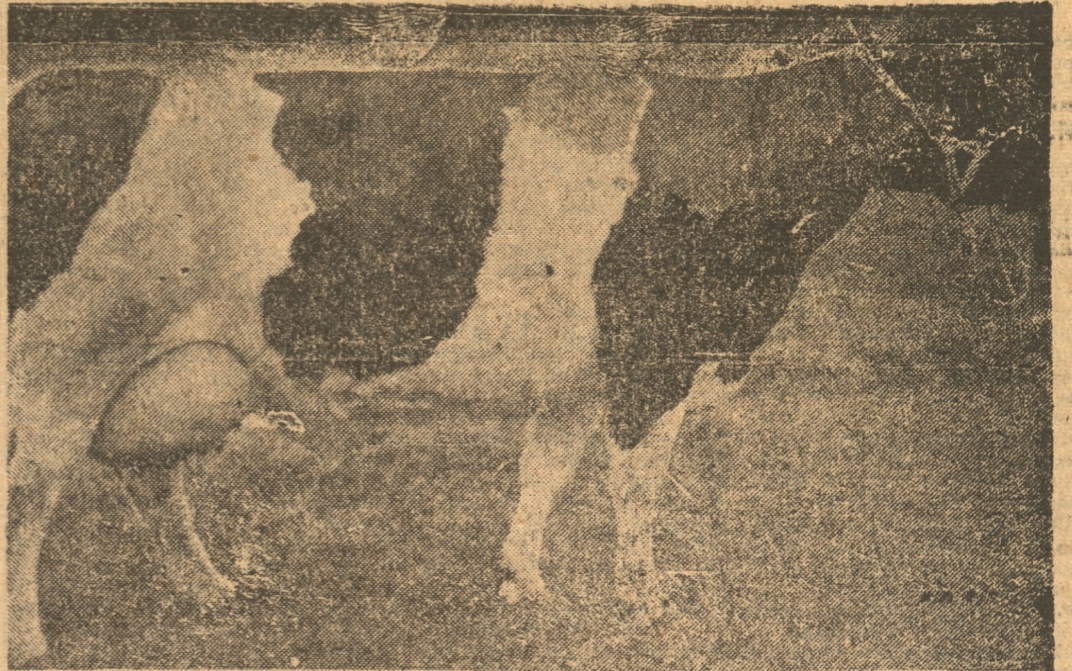
VACA HOLANDESA DE GRAN PRODUCCION DE LECHE

Torneos rotativos todos los años se efectuarán para fomentar el interés por esta clase de animales