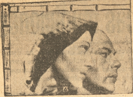
Localidades desde hoy

Mañana estrena el CENTRAL la obra cumbre del cine