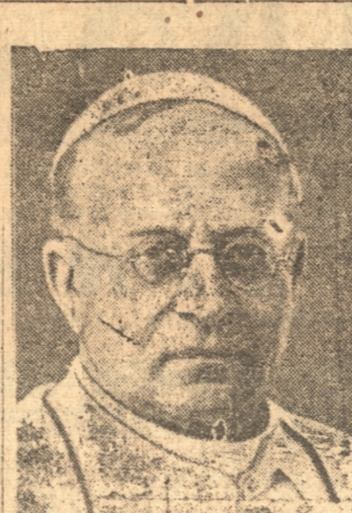
S. S. EL PAPA PIO XI

Según un resumen oficial, reitera la necesidad de volver a Cristo y recuerda que los anales de la Iglesia atestiguan que la protección de la Virgen María y de Dios nunca ha abandonado a los fieles.