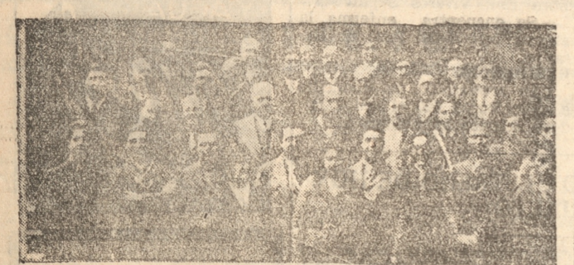
EL GOBERNADOR Y PERSONALIDADES ASISTENTES AL ACTO

Fue investida el miércoles la brigada "Carlos Werner". — Estuvieron presentes en la ceremonia el gobernador de Tomé, las autoridades scoutivas y diversas personalidades