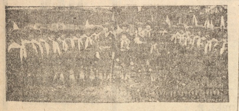
LAS GIRL GUIDES DE BELLAVISTA