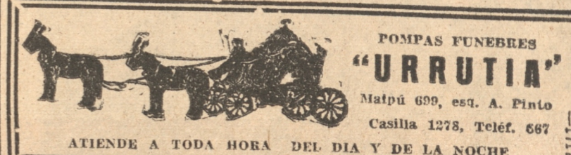
ATIENDE A TODA HORA DEL DIA Y DE LA NOCHE