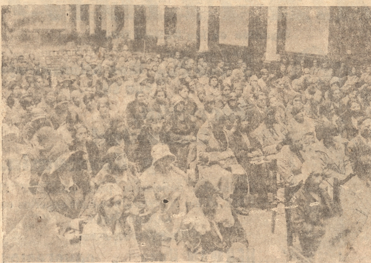
GRUPO GENERAL DE LOS ASISTENTES A LA SESION INAUGURAL DE LA ASAMBLEA

Más de una vez he citado en mis trabajos las elocuentes palabras de Demoor y Jonckheere que sintetizan las condiciones que ha de reunir el educador del presente y del futuro, para afrontar con éxito las grandes responsabilidades que le están confiadas. No resisto al deseo de citarlas una vez más; "La escuela extiende cada vez