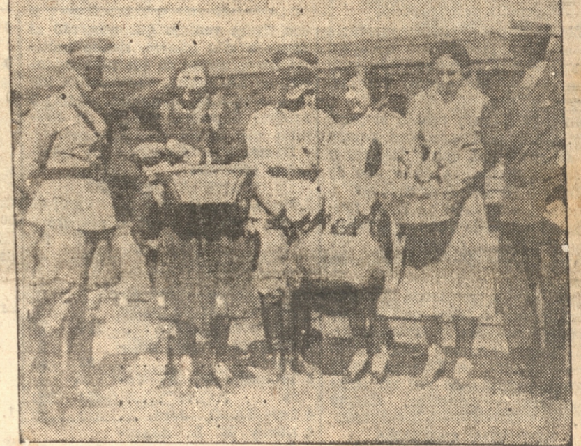
OTRO GRUPO DE DAMAS QUE REPARTIERON OBSEQUIOS A LA TROPA