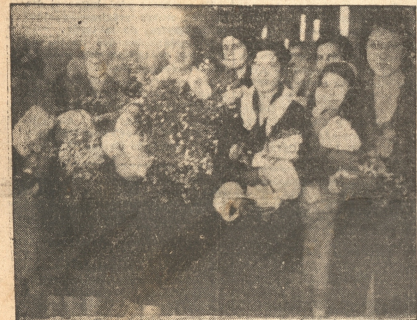
SEÑORITAS QUE REPARTIERON FLORES A LOS SOLDADOS

que ha sabido cumplir con los deberes del soldado. Soldados de mi Patria! El recuerdo perdurará para siempre en nuestros corazones y los agradecimientos de todos los hijos del país serán el mejor emblema de la gratitud nuestra. He dicho". A las 12.20 partía el tren y los soldados desde las ventanillas: dieron los agradecimientos por esta demostración, espontánea del pueblo de la ciudad de Concepción. La banda del Regimiento entonó la canción nacional y el tren poco a poco abandonó la ciudad.