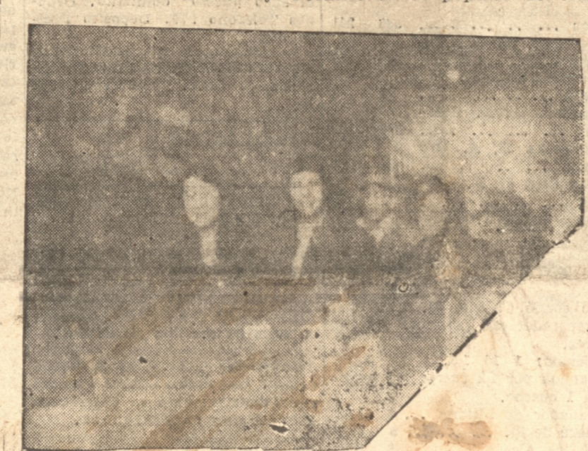
UNA COMISION DE SEÑORAS REPARTIENDO FRUTAS Y CIGARRILLOS A LOS CONSCRIPTOS DEL O'HIGGINS