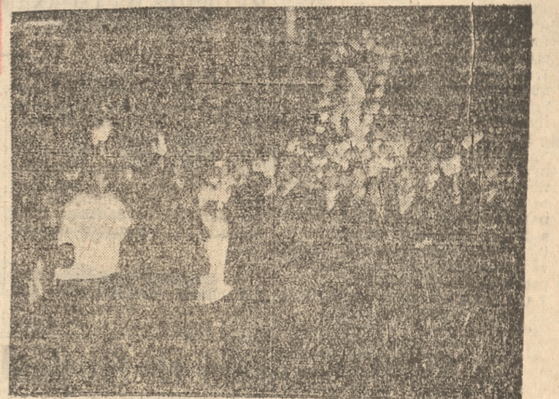
EL ANDA DE LA VIRGEN DE LA CARMEN LLEVADA EN EL DESFILE DE ANOche