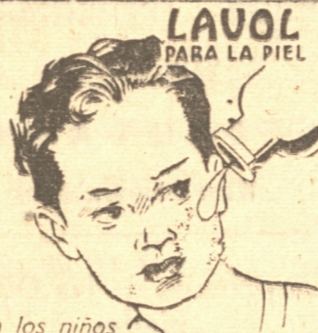
LAVOL PARA LA PIEL

Esta tarde corresponde celebrar sesión a la Municipalidad. Sabemos que en tabla figuran algunas interesantes materias.