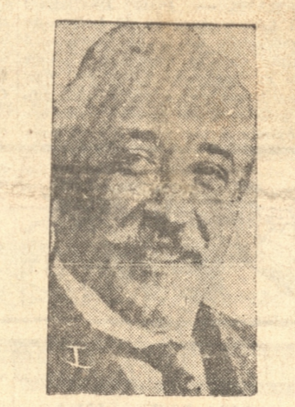
Don Niceto Alcalá Zamora, que ayer renunció a la Presidencia provisional de España

putados vascos y navarros. Cuando iba a realizarse la votación, veinte diputados navarros y vascos se levantaron gritando "Cristo-Res", con lo que irritaron a numerosos diputados socialistas, quienes se adelantaron hacia ellos, produciéndose un pugilato. Renunció Alcalá Zamora. MADRID, 14 (U. P.).— El Presidente Provisional, don Niceto Alcalá Zamora, declaró a un representante de la Unidad Press: "He presentado la renuncia de mi cargo". La decisión del señor Alcalá Zamora se debe a que las Cortes Constituyentes aprobaron el artículo 24 de la Constitución, contra lo cual dió el Presidente su voto, en contra, como primer diputado, debido a que es un ferviente católico. Se teme una crisis de Gabinete. MADRID, 14 (U. P.).— El Gabinete aún no se ha reunido para decidir la renuncia del señor Alcalá Zamora; se teme una crisis ministerial. MADRID, 14 (U. P.).— A las