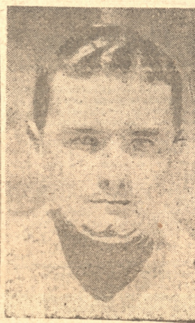
BEBIN que también jugará hoy

leza de Radio C. C. 141 de Concepción todos los hogares podrán oír movimiento a movimiento todos los partidos tanto de Anita como de Loreto, y otros. Un conocido Speaker de la localidad transmitirá los partidos, punto por punto.