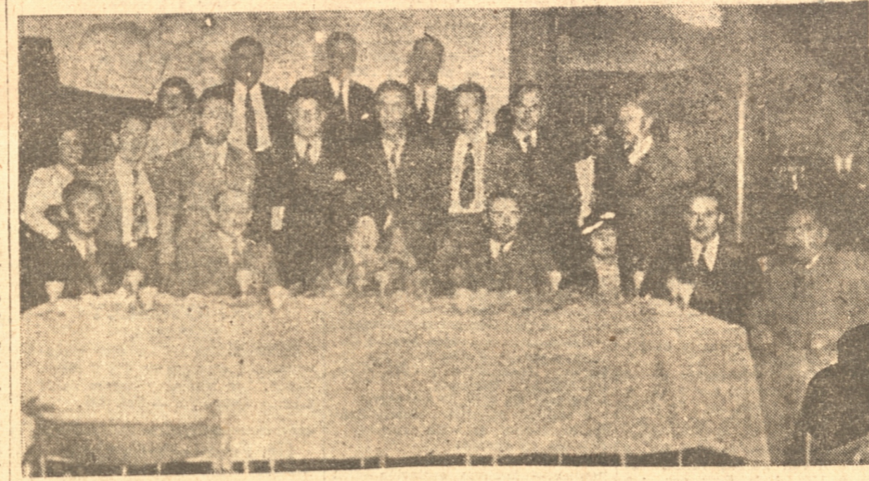
UNA FOTO TOMADA AYER EN EL APERITIVO QUE LE OFRECIO PALET

Los tenistas visitantes todos de reconocida fama, sólo tenían palabras de elogio para el adelanto visible de nuestro Club de Tenis. Las canchas de la Villa, fueron encontradas magníficas, y como las mejores canchas similares de la capital.