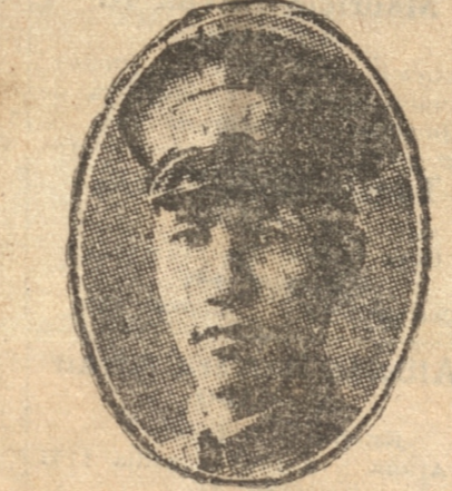
Mariscal Chiang - Kay - Sek, quien, con un ejército de 2 millones de hombres combatiría contra los japoneses.

PARIS, 19. — (UP). — Presidido por M. Briand el Consejo de la Liga de las Naciones efectuó una sesión privada.