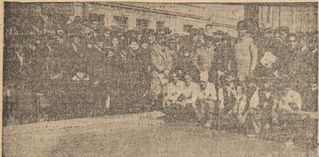
AUTORIDADES Y PARTE DEL PUBLICO ASISTENTE A LA INAUGURACION DE LA PAVIMENTACION.