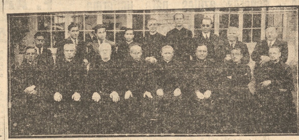
LA COMUNIDAD SALESIANA DE CONCEPCION