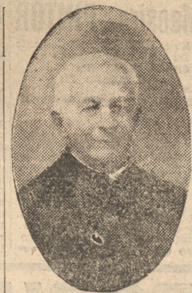
El segundo Rector Mayor P. Paolo Albera.

Y desde entonces, desde los treinta y seis años de edad, vive su vida de perfecto hijo del gran santo, este humilde hermano cuya figura venerable pasa por los claustros salesianos evocando recuerdos.