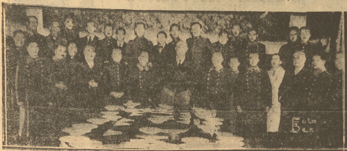
Asistentes al vermouth ofrecido en el Casino de Carabineros.

Por el ordinario de hoy parte a Curicó el distinguido jefe