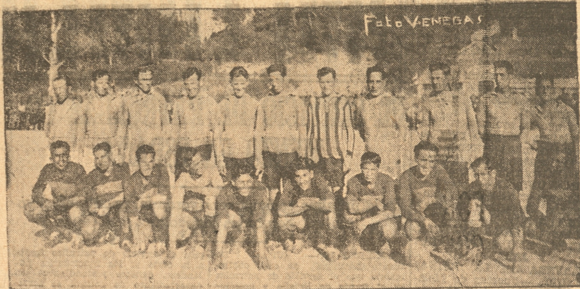
EQUIPOS QUE PARTICIPARON EN UNA DE LAS PRUEBAS DE AYER