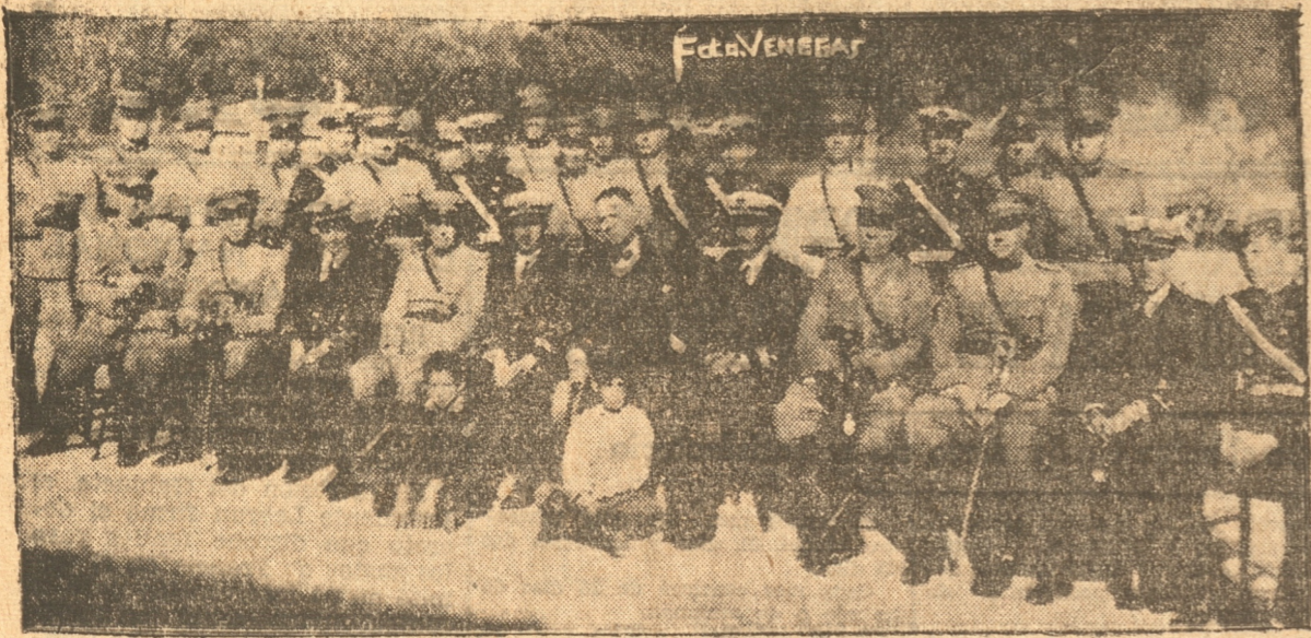
JEFES MILITARES QUE PRESIDERON LA TARDE DEPORTIVA

FUERON MUY FESTEJADOS POR LOS SUBOFICIALES Y CLASES DE LA GUARNICION, LOS SUBOFICIALES Y MARINEROS DE LOS BUQUES DE LA ESCUADRA PERUANA QUE SE ENCUENTRAN EN EL VECINO PUERTO DE TALCAHUANO. — A SU LLEGADA, EN LA PLAZA INDEPENDENCIA, SE ORGANIZO UN DESFILE QUE RECORRIO EN MEDIO DE GRAN ENTUSIASMO LA CALLE BARROS ARANA. — EN EL CUARTEL DEL "CHACABUCO" los SOLDADOS CHILENOS ABRIERON CALLE A LOS MARINOS VISITANTES QUE FUERON ACOGIDOS CON GRANDES DEMOSTRACIONES DE APRECIO. — EL DESARROLLO DE LA TARDE DEPORTIVA Y EL VERMOUTH DE HONOR FUERON BRILLANTES