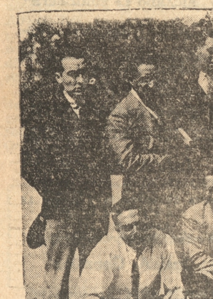
GRUPO DE DIRIGENTES DE LA FEDERACION CICLISTA CHILE Y DE LA ASOCIACION LOCAL POSAN PARA "LA PATRIA"

Se esperaba con impaciencia, dentro la afición, el desarrollo final de la competencia nacional ciclista, para despejar la incógnita de los competidores y la victoria olímpica de las respectivas asociaciones.