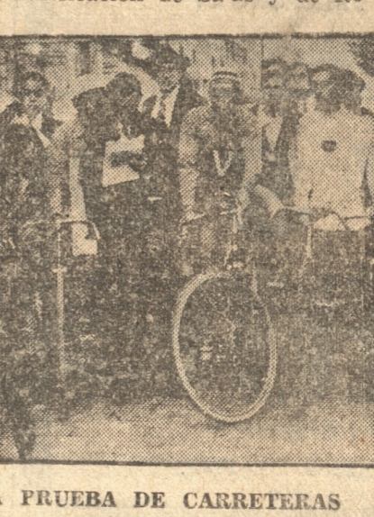
ANTES DE LA PARTIDA DE LA PRUEBA DE CARRETERAS EN LA MAÑANA DE AYER

la prueba de carreteras y la de ligereza. Sin embargo y a pesar de haber ganado Concepción dos de las pruebas el puntaje olímpico da ocho puntos a Santiago, seis a Concepción y tres a Valparaíso con la tercera clasificación de Salas y de Ro-