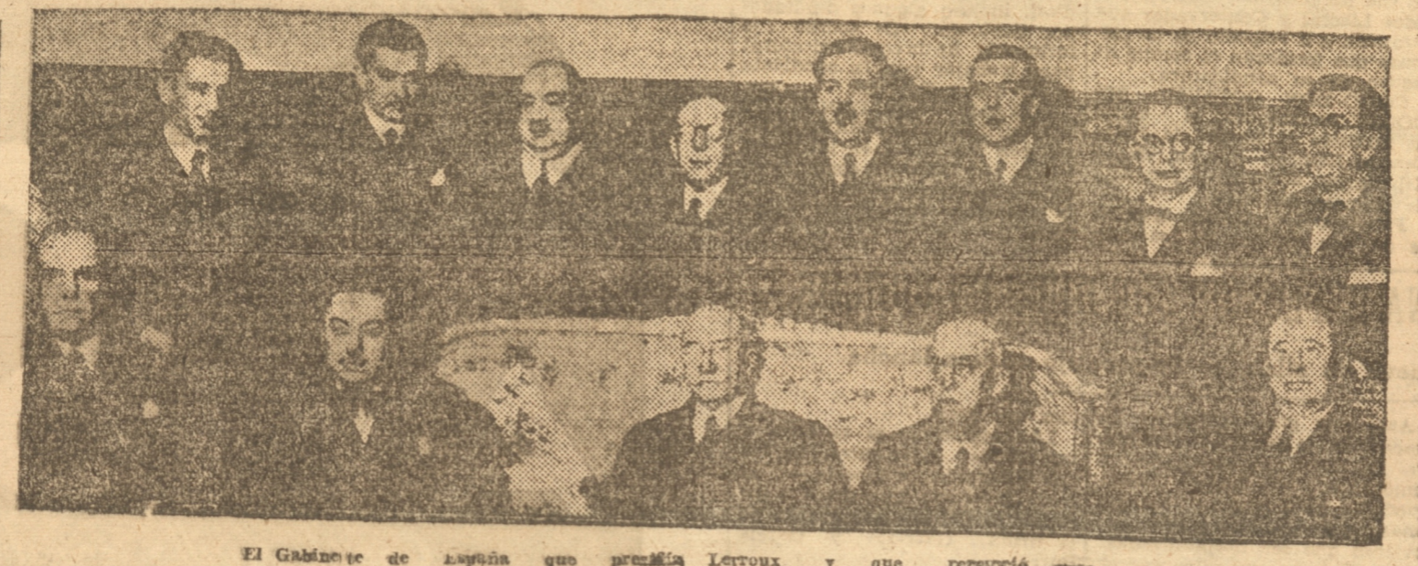
El Gabinete de España que preside Lerroux y que renunció ayer

Los primeros en concurrir al Palacio de Gobierno fué el Presidente de las Cortes Constituyentes don Santiago Alba, quien acompañó al Presidente don Esteban Alcalá Zamora que ratificó al señor Alejandro Lerroux en sus poderes, a fin de constituir un Gobierno de base parlamentaria lo más amplia posible y dentro de la representación de las actuales Cortes.