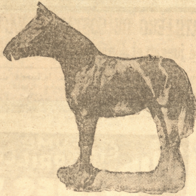
FARAMALLA, QUE SE PEREFA COMO LA ENEMIGA PRECISA DE LA HIJA DE NID D'OR

El pupilo del señor Valk está desde luego afilándose las espartas para batirse con los Chops, las Catalinas, los Auco y demás cracks importados de la capital.