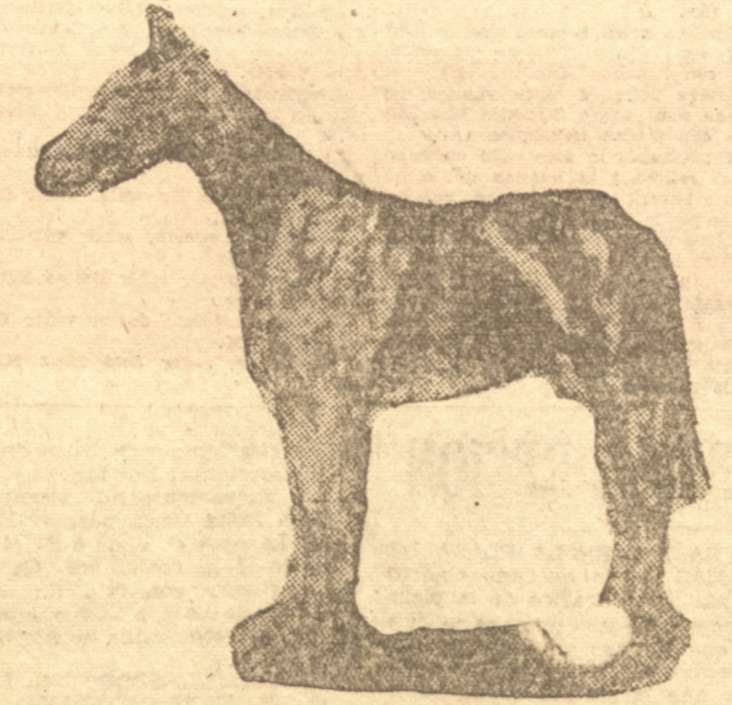
LINA CAVALIERI LA HERMO SA ALAZANA, QUE SE VE EN GRAN ESTADO PARA LA PRUEBA DE POTRILLOS