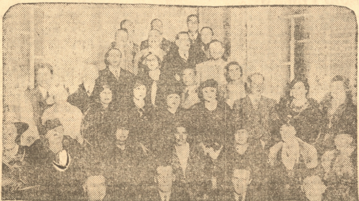
ASISTENTES A LA COMIDA OFRECIDA POR LA COLONIA ITALIANA EN HONOR DE LOS ALPINITAS ITALIANOS QUE NOS VISITAN

Una injusticia hecha a un solo hombre es una amenaza para todos.