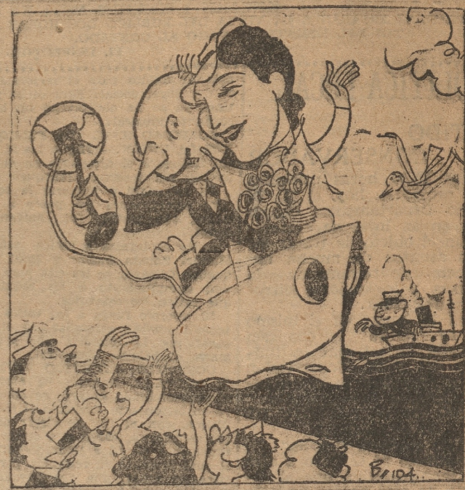
De "El Romancero de Pipo"

Hoy a las 18 horas, los panificadores de Concepción y Talcahuano verificaron un conflicto público en la Plaza Condell invitando a todas las colectividades obreras y pueblo en general.