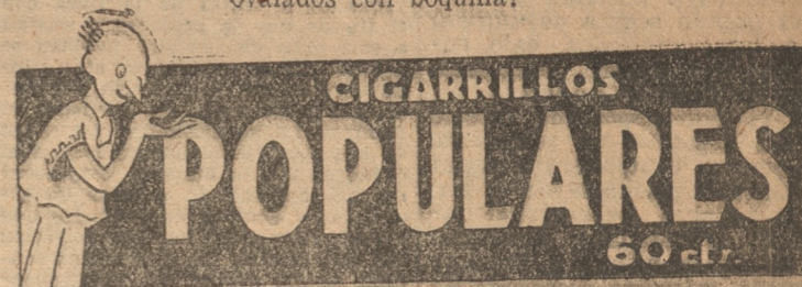
"El Romancero de Pipo", se publica Jueves y Domingos. — 15287

— Si la cosa es muy sencilla: ¡es que... fumo Populares ovalados con boquilla!