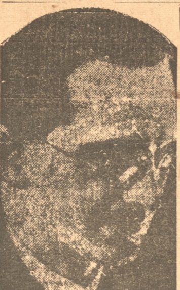
KONRAD HENLEIN, jefe de los sudetes

SEIDENBERG, 21.— (UP).— Los soldados checoslovacos se muestran activos cavando trincheras en toda la frontera. Fuera de esto, la aldea que fue teatro de una escaramuza el martes en la madrugada está tranquila. Soldados checos y alemanes patrullan la frontera a una distancia que pueden oírse unos de otros, pero no hay indicaciones de que las hostilidades estén a punto de romperse.