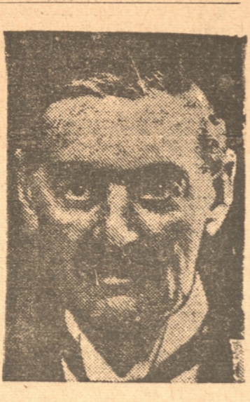
NEVILLE CHAMBERLAIN, que hoy irá a Godesberg y se entrevistará con Hitler