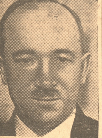
BENES, Presidente de Checoeslovaquia, país que ha aceptado el plan franco-británico

ASUNCION 23.— (UP).— Se informa autoritadamente que las elecciones presidenciales se realizarán en marzo de 1939 y que el nuevo Presidente de la República asumirá el mando en agosto del mismo año.