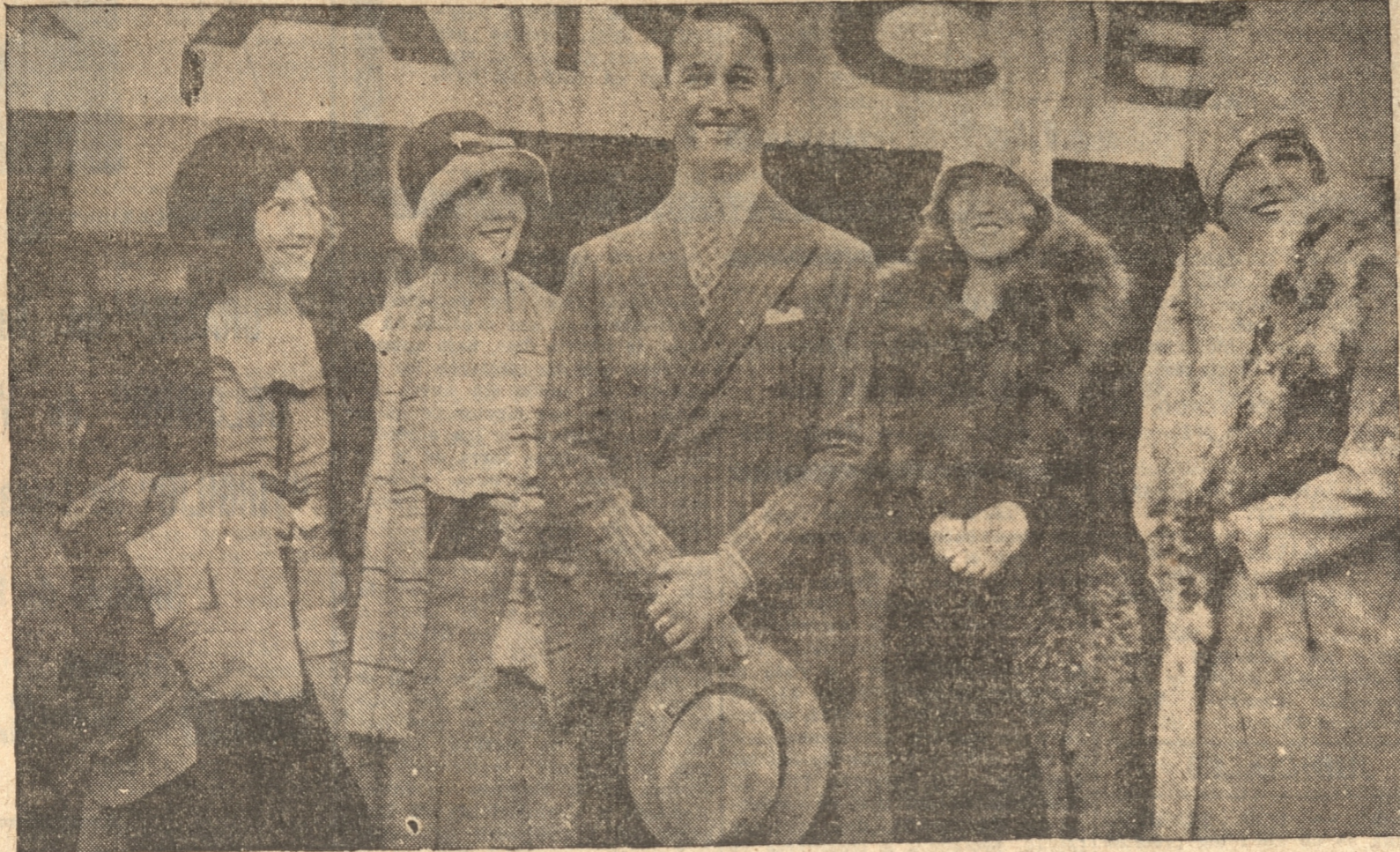
EL GALAN DE "EL DESFILE DEL AMOR" Y DE "EL GRAN CHARCO", RETRATADO EN NIZA EN COMPANIA DE LAS ACTRICES CINEMATOGRAFICAS DORIS HILL, MARY BRIAN, RUTH TAYLOR Y LILY DAMITA