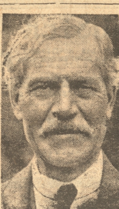
RAMSAY MACDONALD, LIDER LABORISTA

En su línea, presidente en la carrera política, cuando llegó la tarde del 3 de Agosto de 1914. Fue día tomó el nombre Mac-Donald en la Cámara de los Comunes y declaró con su característica sinceridad