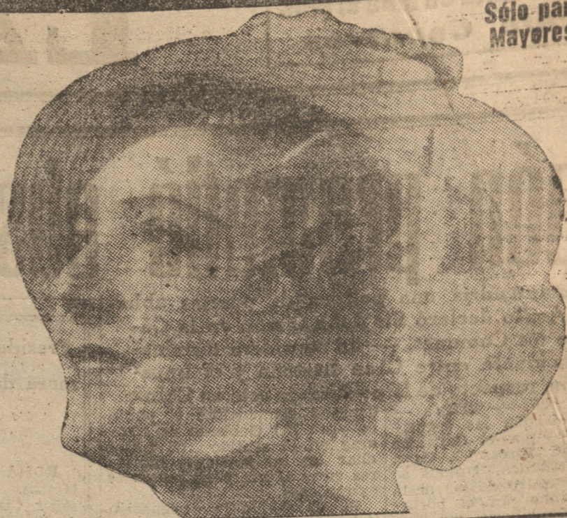
Sólo para Mayores

Si fama atraviesa mares y montañas. El nombre de este film está en todos los labios.