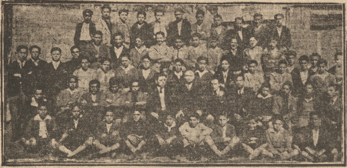
GRUPO GENERAL DE ALUMNOS DE LA ESCUELA VOCACIONAL N.º 29 DE ESTE PUERTO

Actividades desarrolladas por este plantel de educación