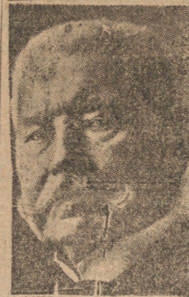
EL PRESIDENTE DE ALEMANIA, VON HINDEMBURG

El Gobierno de Alemania ha resuelto últimamente designar el día de hoy, Fiesta del Trabajo, para dedicarlo a dignificar a ese país en