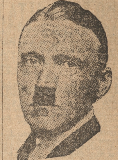
EL CANCELLER HITLER