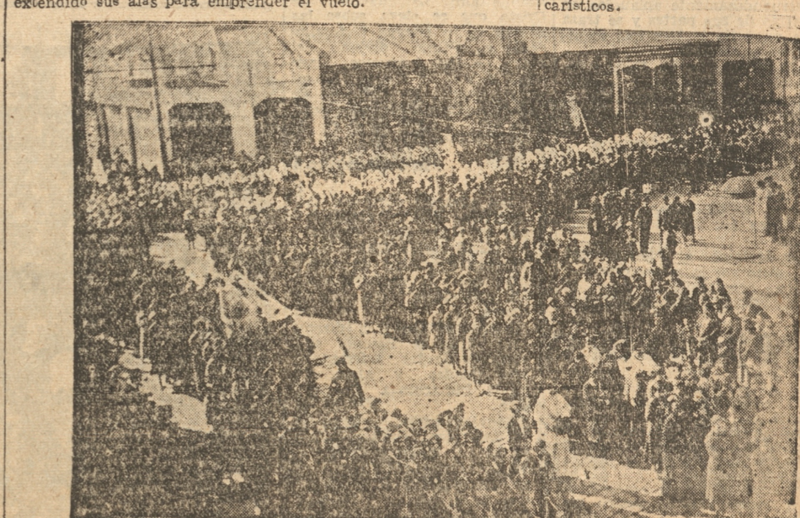
UN ASPECTO DE LA GRAN PROCESION DE AYER