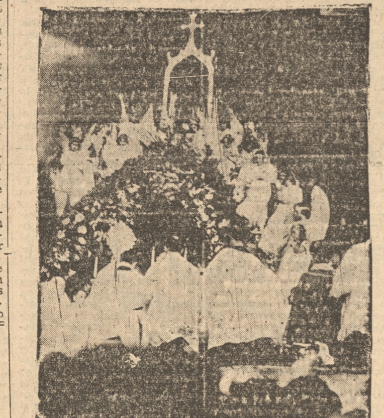
El Excmo. Sr. Nuncio impartiendo la solemne bendición

Pocas oportunidades se han presentado a nuestra ciudad para ver una multitud tan grande reunida en la enorme explanada del Parque Ecuador. Era un mar humano que se agrupaba alrededor del altar erigido frente a la calle Colo Colo y que procuraba asociarse, en toda forma, al homenaje a Nuestro Señor Jesucristo. Fue tan grande la afluencia de público que los cordones de los carabineros fueron rotos por la multitud que pugnaba por estar lo más cerca posible del sitio en que iban a desarrollarse las ceremonias.