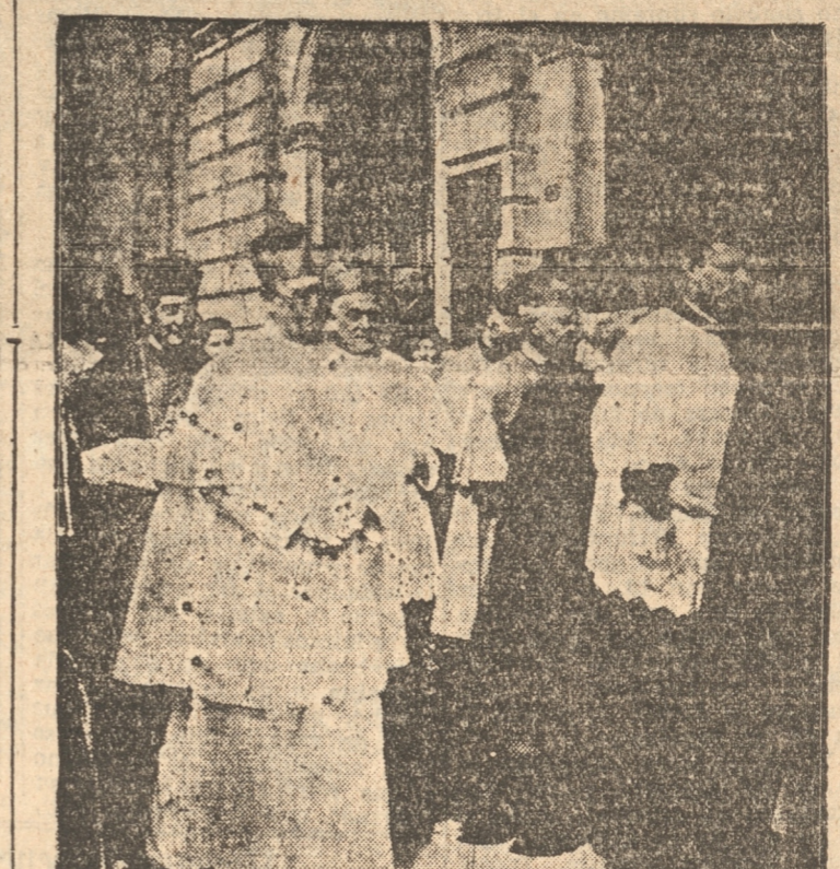
Los prelatos saliendo de la Catedral después de la Pontifical

sentimiento patriótico, la canción chilena. Las miles de voces, de hombres, mujeres y niños de toda condición social, fueron una vibrante demostración del sentimiento patrio de los católicos, allí reunidos en homenaje al Santísimo Sacramento. Fue un momento conmovedor y que a muchos arrancó lágrimas. Voces plélicas de entusiasmos patrióticos surgidas no solamente de entre la compacta multitud ubicada frente al altar levantado en el Parque Ecuador, sino que de entre todas las avenidas del cerro Caracol, próximas a ese sitio, y que en las esquinas de la concurrencia, entonaron las notas de la canción patria. Se asociaron en una misma invocación en ese instante solemne e impresionante. Parece que una sola corriente hubiera electrizado a los miles de concurrentes que llenaban la inmensa explanada, pues todos, sin excepción, cantaron, con entusiasmo idéntico, el himno nacional; se confundieron todas las voces de los que habían ido a rendir y presenciar las homenajes a Jesús Hostia; las de los niños más pequeños que con igual fé, hicieron su peregrinación acompañando al Santísimo, con las de personas ya ancianas curvadas por los años. Era una sola invocación patriótica frente al altar en que estaba el Santísimo Sacramento, y antes que el Excmo. señor Nuncio Apostólico impartiera la bendición al pueblo de Concepción.