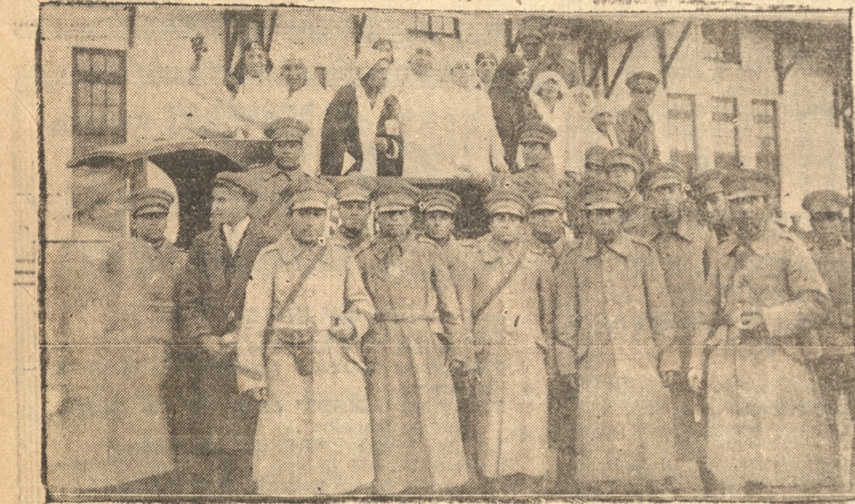
TROPA DEL REGIMIENTO O'HIGGINS JUNTO A UNO DE LOS CAMIONES

Emplastro de Alcock—Base: Resina de Borgoña, Goma Elemi, Alcanfor e Incienso. NOTA: Estos emplastos vienen ahora en sobres de papel transparente.