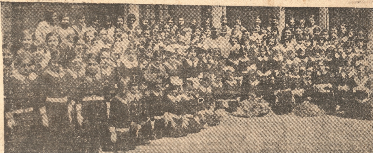
GRUPO DE PREPARATORIAS DE LA INMACULADA e HIJAS DE MARIA