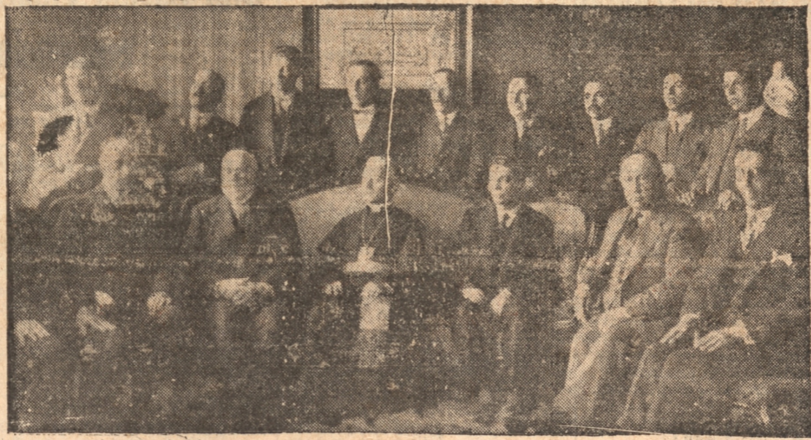
EN EL SALÓN DE HONOR DEL OBISPADO