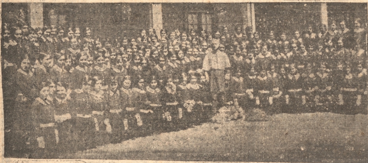
EN EL COLEGIO DE LA INMACULADA DE CONCEPCION

En momento oportuno usó de la palabra el Obispo señor Fuenzalida, contestando al señor Nuncio.