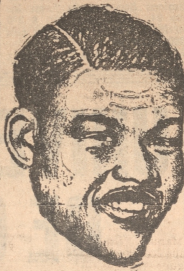
alocado como suicida, la seguridad de la victoria del campeón se hacía patente.