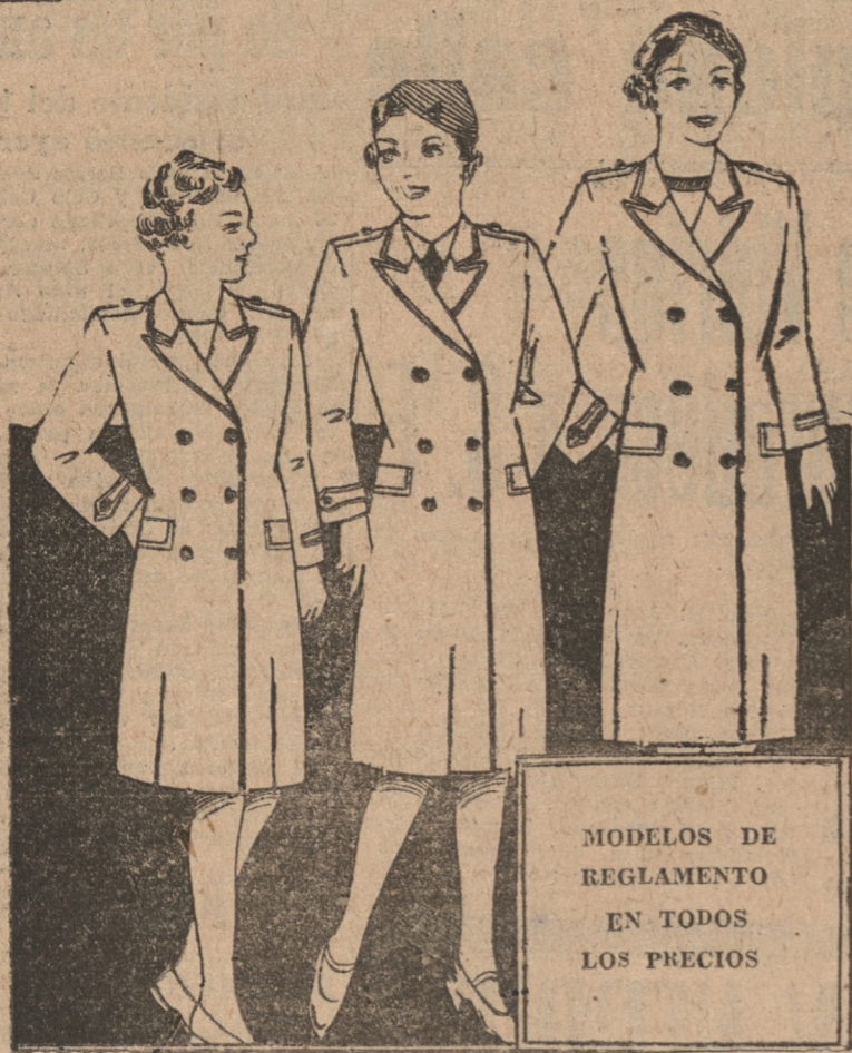
MODELOS DE REGLAMENTO EN TODOS LOS PRECIOS