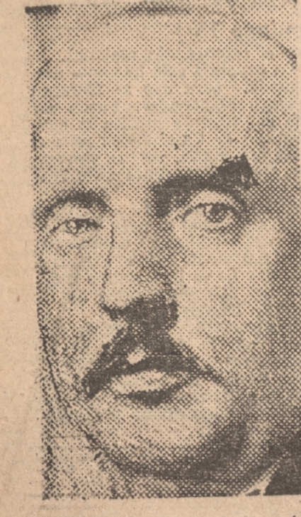
MIKLAS, Presidente de Austria.

SE REUNE EL GABINETE CHECOESLOVACO PRAGA, 11. (UP). — El Consejo de Ministros está reunido en sesión extraordinaria.