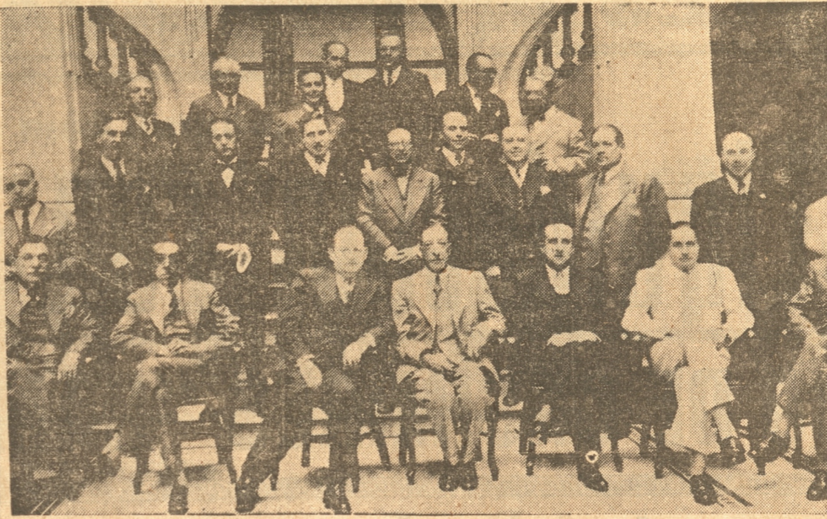
Asistentes al almuerzo ofrecido ayer en el Club Concepción por el Directorio del Club Hípico de nuestra ciudad a la delegación hípica del Hipódromo Chile de Santiago

UN PENSAMIENTO: No dejes para mañana lo que debes hacer hoy. HOY San Eustaquio MASANA San Nicandro