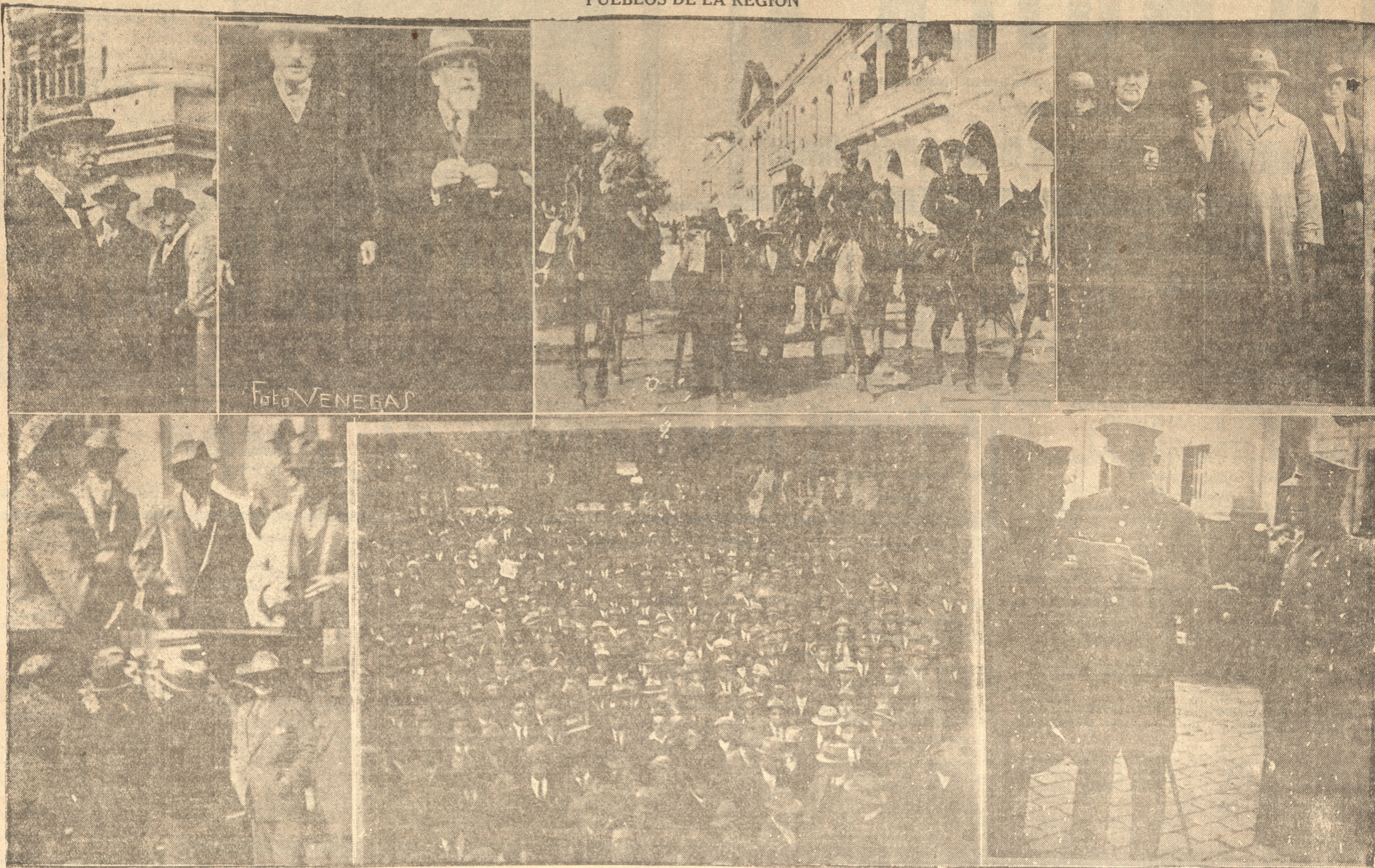
1) — EL INTENDENTE DE LA PROVINCIA, SEÑOR MANUEL A RISTIDES BENAVENTE, DIRIGIENDOSE A EMITIR SU VOTO. — 2) EL ALCALDE SEÑOR ALFREDO DEL RIO S., Y EL PRESIDENTE DEL PARTIDO RADICAL SEÑOR IGNACIO MARTINEZ URRUTIA, SALIENDO DEL LOCAL EN QUE EMITIERON SU VOTO. — 3) — INDIVIDUOS SORPRENDIDOS COHECHANDO SON CONDUCIDOS A LA COMISARIA. — 4) — EL OBISPO DE LA DIOCESIS, MONSEÑOR GILBERTO FUENZALIDA, UN INSTANTE DESPUES DE HABER VOTADO. — 5) — DOS DE LOS DIVERSOS CORRILLOS QUE SE FORMARON PARA COMENTAR LOS PROBABLES RESULTADOS DE LA ELECCION. — 6) — PARTE DEL NUMEROSO PUBLICO QUE CONCURRIO A LA PLAZA INDEPENDENCIA A OIR LAS INFORMACIONES DE "LA PATRIA" TRANSMITIDAS POR MEDIO DE LA "PHILIPS" RADIO. — 7) — EN LAS PRIMERAS HORAS DE LA MAÑANA EL PREFECTO, TENIENTE CORONEL SEÑOR ENRIQUE DELANO S., IMPARTE INSTRUCCIONES A FIN DE QUE LAS FUERZAS DE CARABINEROS ADOPTEN LAS MEDIDAS DE PREVISION NECESARIAS.

LOS PRIMEROS DETALLES FUERON DADOS A CONOCER CON TODA PRONTITUD POR NUESTRO DIARIO. — LOS RESULTADOS DE CADA COMUNA Y DEPARTAMENTO. — EL COMPUTO GENERAL EN LA PROVINCIA. — INFORMACIONES ESPECIALES DE NUESTROS CORRESPONSALES Y PARA LOS DIVERSOS PUEBLOS DE LA REGION