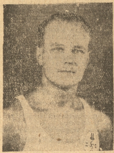
Lord Cochrane, después de su regreso de Alemania ha mejorado mucho

La brillante iniciación de la competencia de basketball organizada tan felizmente por el Lord Cochrane en disputa por la Copa Carlos Cochrane, da margen a suponer que las veladas que vienen han de ser tan exitosas o más que la primera. Aunque debemos reconocer que en la del Lunes había cuatro cuadros con arrastre, hoy se juega un cambio un partido cuyo sólo anuncio despierta especial interés, no por una rivalidad clásica sino porque por el poder actual de ambos teams así como por su tipo de juego hacen que se los considere dos temibles rivales y dos calificadas oponentes a la copa que se disputa.