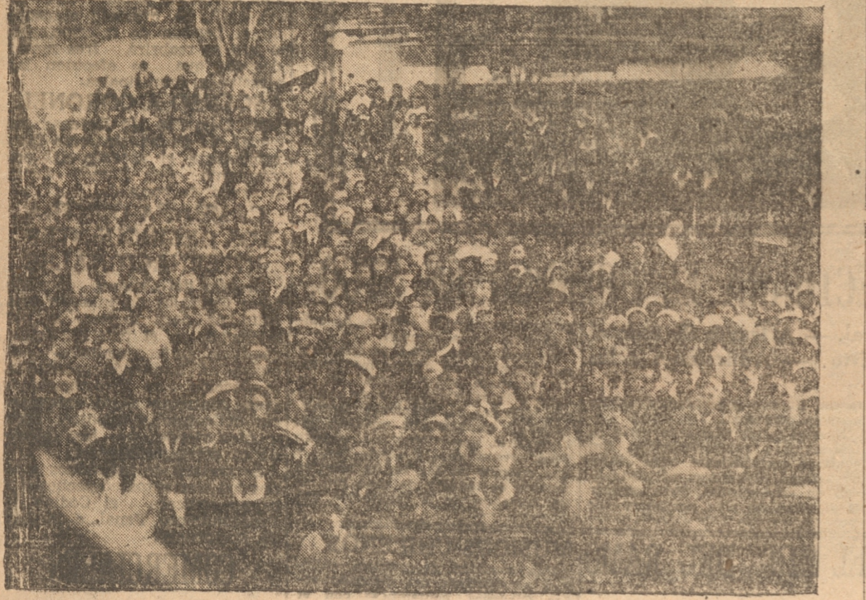
GRUPOS DE NIÑOS DURANTE LA VISITA A NUESTRA CIUDAD

des de este importante establecimiento. SALUDO A LAS AUTORIDADES Momentos más tarde, los alumnos y sus acompañantes, pasaron a saludar a las autoridades locales para visitar, a continuación, la Plaza Independencia y los principales paseos.