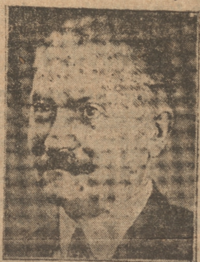
Presidente de Francia M. Lebrun

Han circulado rumores de que la presidencia del Consejo será ofrecida al Mariscal Petain.