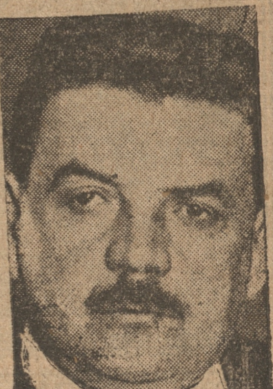
M. Edouard Herriot que forma parte del nuevo Gabinete

M. Doumergue, habiéndoles de la renuncia, que tenía, firmada, en su bolsillo, les dijo: "Ahora se lo que tengo que hacer. No puedo continuar sin mayoría, pues sería