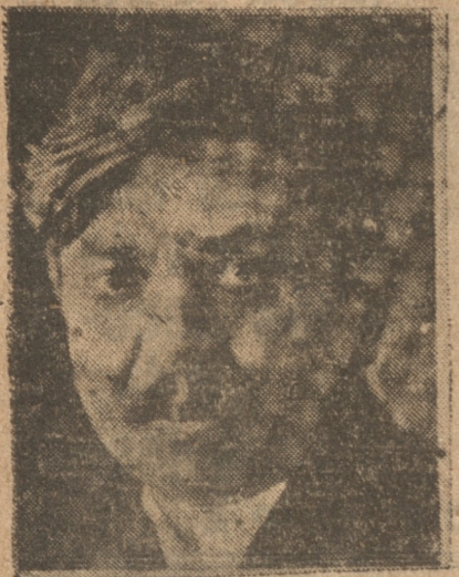
M. Tardieu, otro miembro del Gabinete

EL GABINETE QUE PRESIDIA M. DOUMERGUE RENUNCIO EN LA MAÑANA DE AYER M. LAVAL FUE LLAMADO POR EL PRESIDENTE LEBRUN PARA ORGANIZAR EL NUEVO MINISTERIO, PERO FRANCASO EN SUS GESTIONES. — UN LLAMADO DE M. DOUMERGUE A LA NACION FRANCESA. — M. ETIENNE FLANDIN LOGRO FORMAR EL NUEVO GABINETE EN LA TARDE. — SE HAN ADOPTADO PRECAUCIONES PARA EVITAR DESORDENES