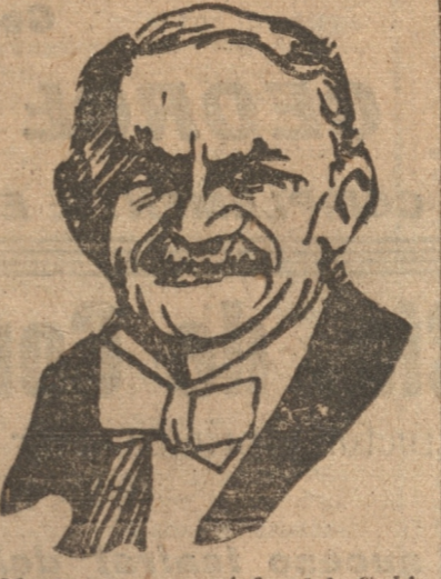
M. Doumergue, jefe del Gabinete renunciante

PARIS, 8. — (UP). — M. Doumergue escribió a las 8.30 de la mañana una carta de renuncia, la cual someterá a la consideración del Gabinete a las 10 horas.