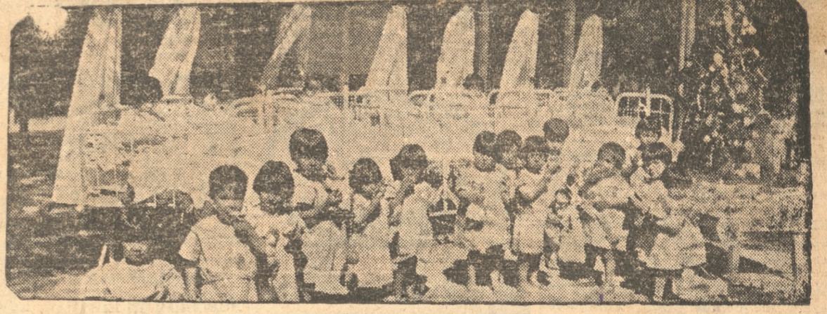
GRUPO DE HUERFANITOS QUE AYER RECIBIERON OBSEQUIOS

MUKDEN, 23, (U. P.).— Los nipones terminaron la campaña que emprendieron al norte de esta ciudad con el objeto de seguir el retro de las fuerzas irregulares chinas.