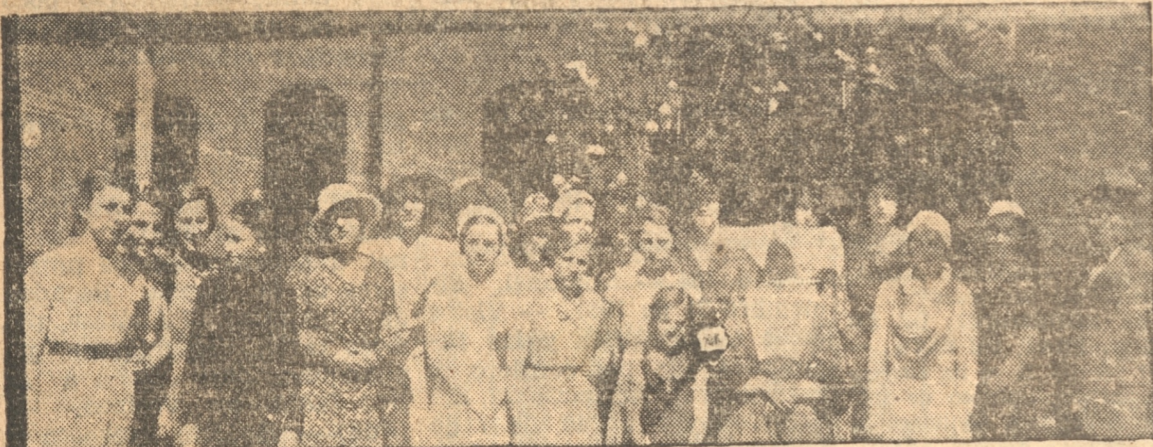
DAMAS DE NUESTRA CIUDAD QUE REPARTIERON LOS REGALOS

Según laudable práctica establecida se dará la Sagrada Comunión en la Misa de Media Noche a los fieles que lo soliciten.