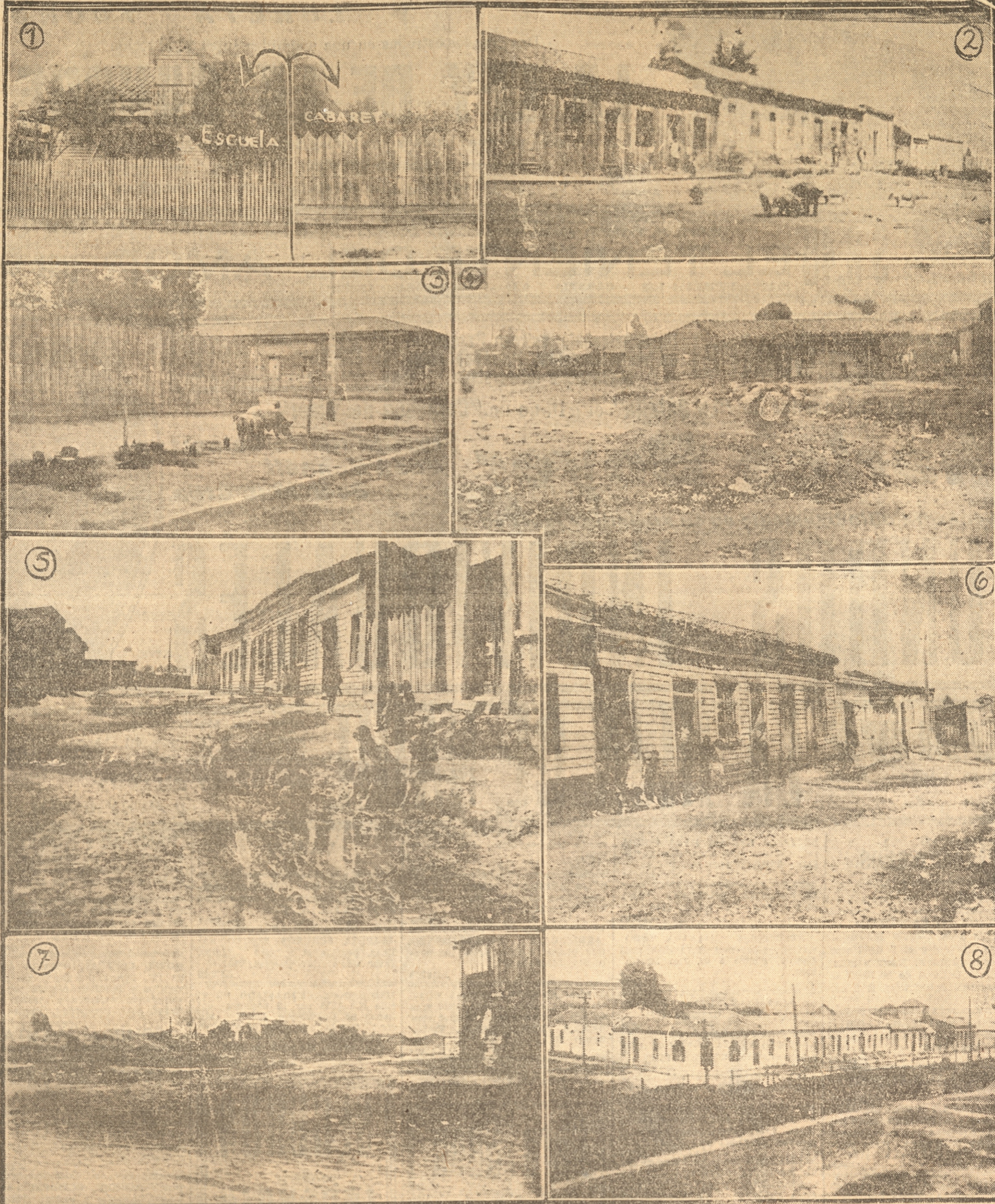
1. La escuela que funciona al lado de un cabaret. Es ésta una deficiencia que debe solucionarse. Los vecinos serios del barrio así lo solicitan, para bien de sus hijos.—2. Un aspecto de la calle Anibal Pinto, a diez cuadras escasas de la Plaza de Armas. Es increíble.—3. Los cerdos libremente se pasean por las calles.—4. Sitio donde se albergan los cesantes, frente a la Estación Andalín.—5. Los niños juegan en medio de todas las inmundicias del Pasaje Zulaica.—6. Las casas del citado pasaje son un peligro para la salubridad de sus moradores.—7. Avenida Argentina esquina Anibal Pinto, donde antes existía la laguna de los negros. Hoy es un inmenso basural.—8. La calle Campolican cortada por la línea férrea. Los vecinos solicitan su apertura.—

En la Avenida Argentina, entre Anibal Pinto y Campolican, donde antiguamente estaba la laguna de los Negros, pidieron los vecinos fuera colocada una luz, pues ese sitio por su oscuridad ofrece en las noches innumerables peligros a los transeúntes. Hace de eso seis meses y la luz no aparece aún. También se forma allí en el invierno, un verdadero río que origina después un barril de