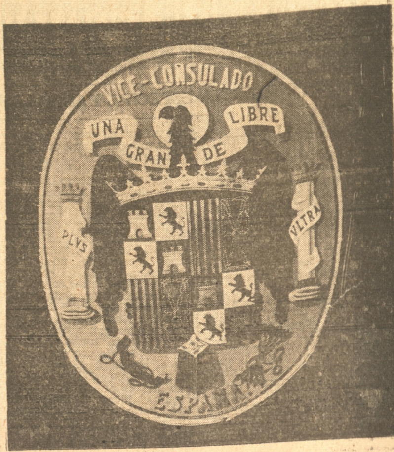
Escudo de España, ordenado según decreto reciente del Gobierno del Excelentísimo General Francisco Franco

Se exhibe en una de las vitrinas de la Casa Schultz. — Lo que significa. — Oficina consular