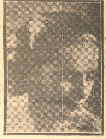
Este festival se realizará en el curso de la próxima semana en el Teatro de la Universidad.