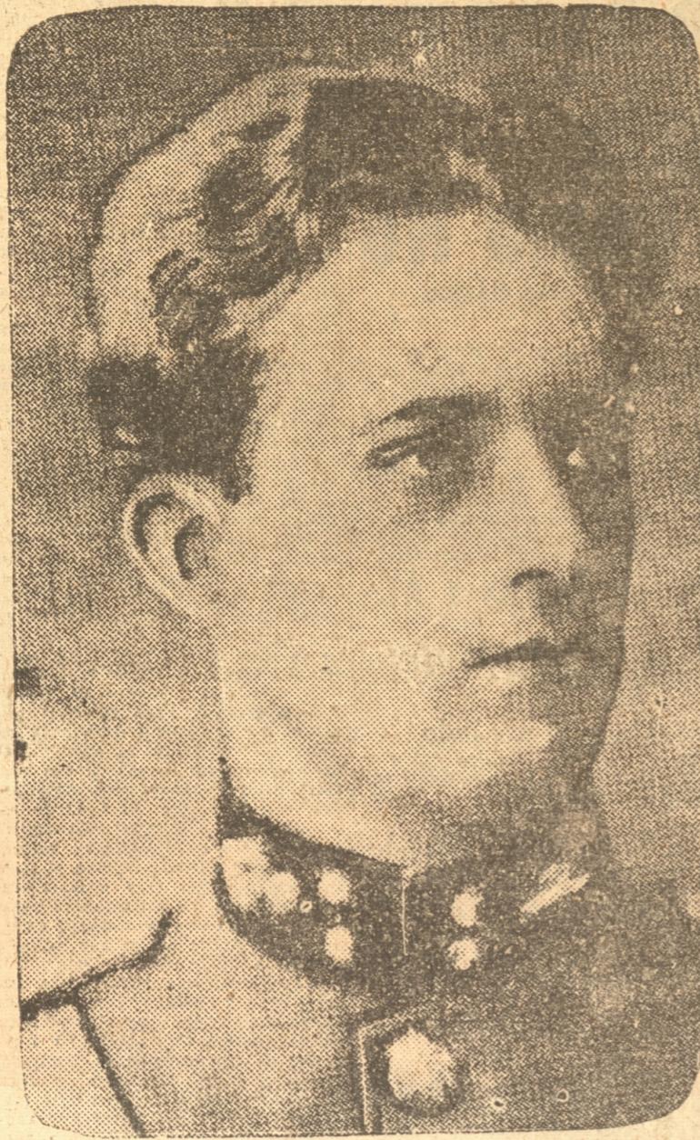
S. M. el Rey Leopoldo III de Bélgica, que con tanto acierto dirige a la progresista nación belga.

Hoy, esta nación se siente alborozada ante el aniversario del natalicio de su Augusto Rey, y por esto, este día es de fiesta nacional en toda Bélgica.