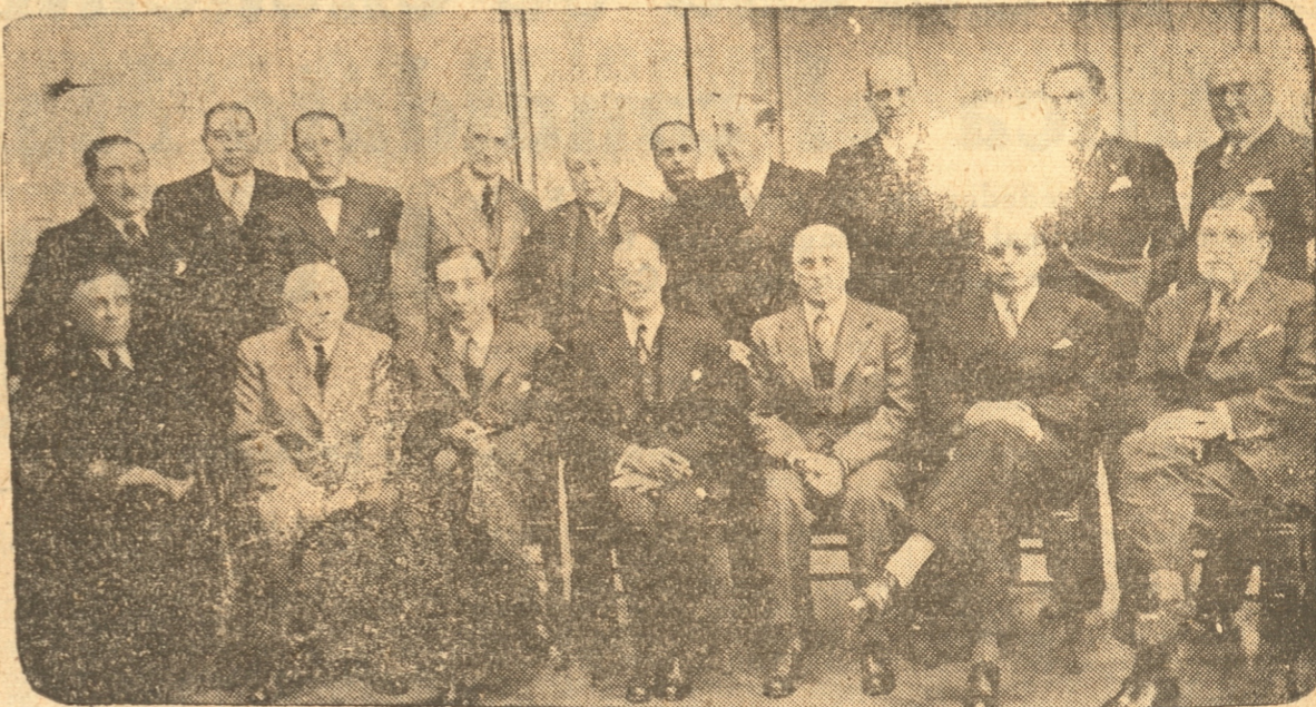
Grupo de los asistentes al almuerzo ofrecido ayer en el Club Hípico.

Tal como estaba anunciado, a mediodía de ayer, el directorio del Club Hípico de Concepción, ofreció un almuerzo en el Club Hípico, en