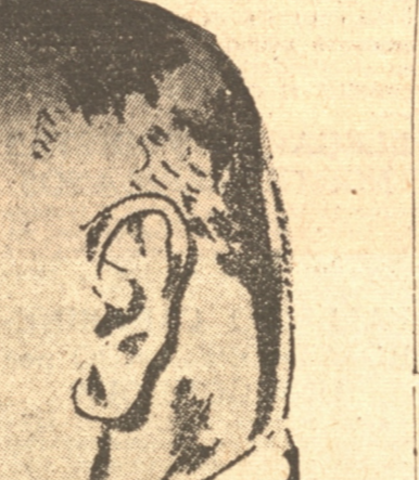
KONSTANTIN VON NEURATH

Hay quien interpreta la "Neurathienia", dijimos, como una anestesia. Su misión es suavizar los efectos de los golpes dramáticos de Hitler o de sus discursos. Cada vez que se destruye un pedazo de tratado o se amenaza a alguna nación vecina, von Neurath llega de atrás a calmar a excitar, a negociar.