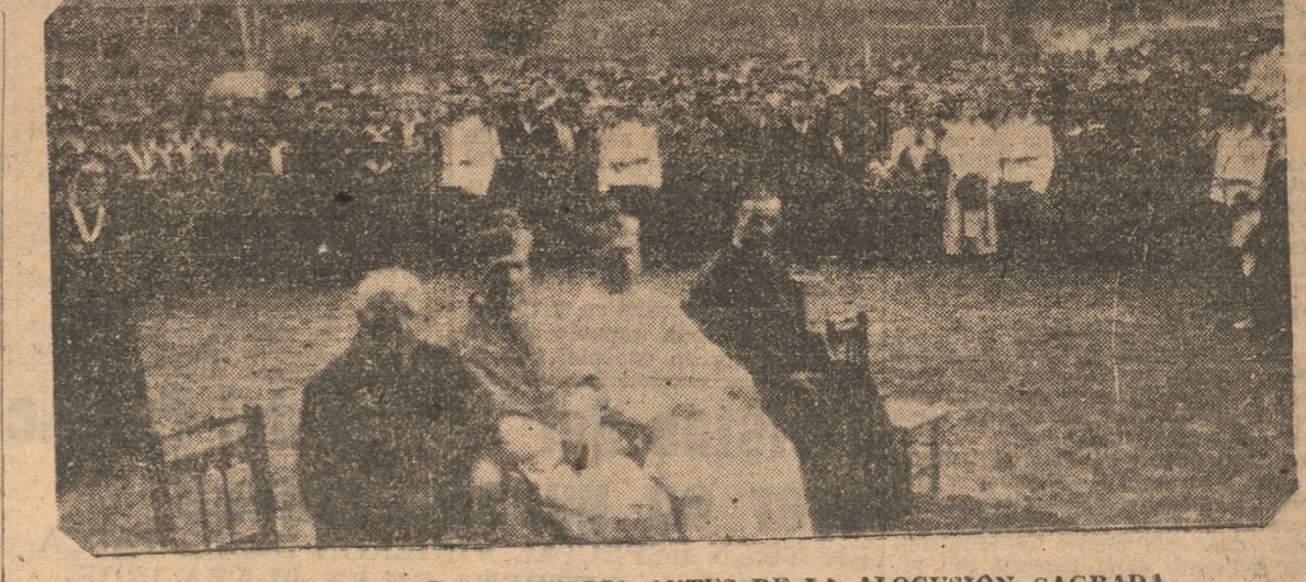
EN LA EXPLANADA DEL SEMINARIO ANTES DE LA ALOCUCION SAGRADA