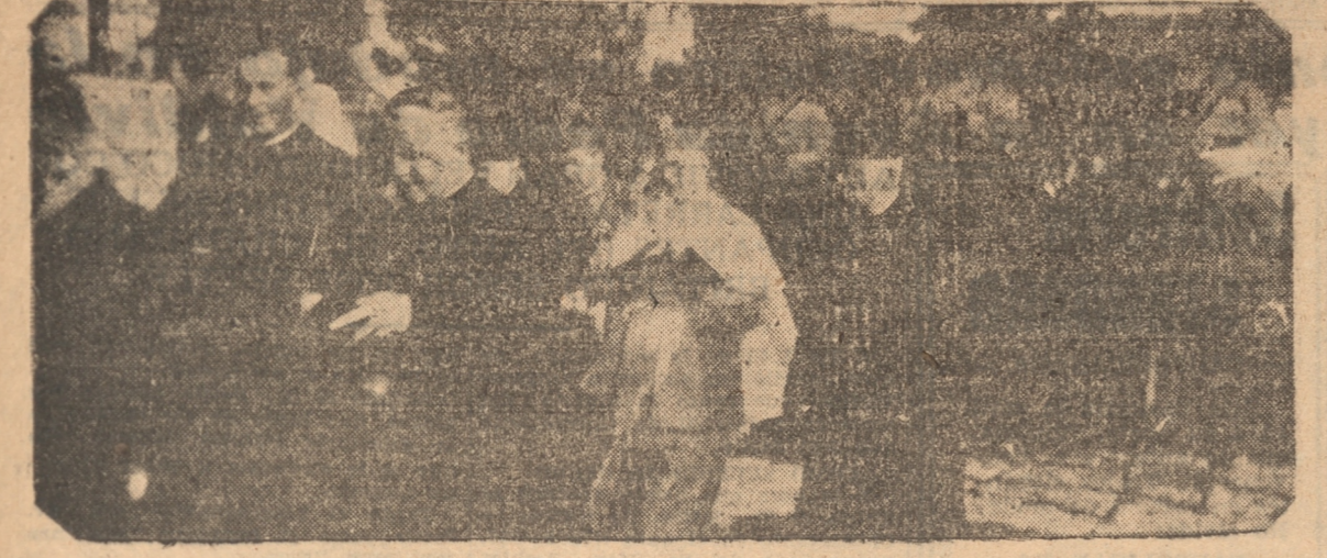
LOS EXCMOS. SEÑORES OBISPOS AL INICIARSE LA ROMERIA

sobre el mar humano. En ningún momento disminuyó el entusiasmo. Canticos y plegarias, das de que se puso en marcha la columna hasta que se disolvió en la explanada, resonaban por los aires y formaban un coro inmenso en torno de la Reina de los Cielos. Y cuando al caer la tarde comenzó la multitud a dispersarse en todas las direcciones, parece que quedaba algo flotando en el ambiente helado ya por el crepúsculo, algo como el espíritu de una gran fiesta que había embargado los corazones.