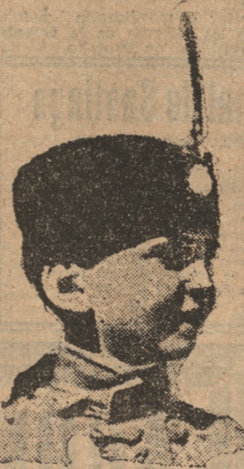
EL REY NIÑO, PEDRO II DE YUGOSLAVIA

un gran duque ruso, Juan Constantínovich, pero poco después del estallido de la revolución bolchevique éste fué asesinado. Cuando en la primavera de 1921 pasó un mes en Belgrado, pedí audiencia al entonces príncipe regente Alejandro (en agosto del mismo año subió al Trono por la muerte de su padre). Vivía en una modesta casa, con sólo planta baja que un comerciante le había cedido, pues el nuevo Palacio Real no estaba aun terminado. La primera cosa que observé en el joven príncipe fué su aspecto melancólico. La gente de los Balcanes no suele ser alegre; han sufrido demasiado durante muchas generaciones y no conocen las comodidades de la vida. La enfermedad de su augusto padre, el estado mental de su hermano, la trágica viudez de su hermana, los recuerdos de la guerra, las complicaciones políticas, así como la neurastenia innata de toda su familia, se notaban en seguida en el rostro moreno del regente. Sin embargo, en el curso de la conversación se animó bastante y en la divertida lucha que se entabló entre nosotros, se declaró vencido, riéndose. Yo insistía en hablarle de política y él a mí de las bellezas naturales de Dalmacia que iba a visitar. Finalmente hablamos de política: Alejandro Karajorgevich resultó sincero y hasta comunicativo y con respeto de algunos pronombres políticos pronunció ante el periodista aprecia-