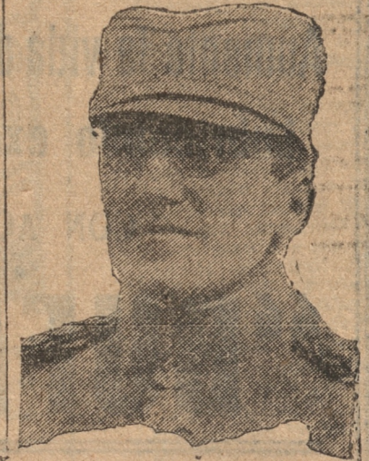
ALEJANDRO DE YUGOSLAVIA, asesinado en Marsella