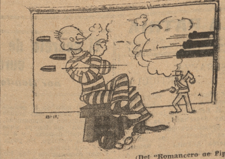
(Del "Romancero de Pipo")

El mejoramiento económico del país importa aumento y mayor cantidad de trabajo, alza de los jornales y abaratamiento del costo de la vida. El mejoramiento general de las industrias representa la más eficaz protección y amparo positivo y real a todas las clases sociales de es-