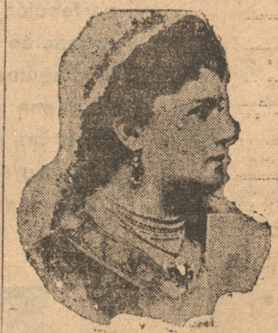
LA REINA DRAGA, esposa morganática del Rey Alejandro II, de la rama Obrenovich, y muerta también por los conspiradores

Italia seguramente no aprovechará la triste ocasión para realizar sus planes en el Adriático. Sin embargo, tampoco se le puede pedir que durante toda la minoría de edad del nuevo Soberano suspenda su política de expansión hacia el Este y deje de escuchar las voces que le lleguen eventualmente de Dalmacia. Hay cronistas que expresan su temor de que la muerte violenta del Rey Alejandro sea el comienzo del derrumbamiento del Estado yugoeslavo. Nosotros no iremos tan lejos; sin embargo, no se puede desconocer la importancia del acontecimiento desde todos los puntos de vista. ¿Qué será de la Pequeña Entente? ¿Qué será del bloque balcánico? ¿Qué será de la alianza franco-yugoeslava? — André Révész.