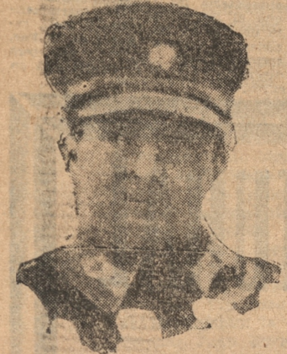
EL PRINCIPE MILOŠ, REGENTE DEL REINO

Jorge el Negro fué elegido en 1803 jefe supremo de las armas de Serbia. — Honores para sus descendientes