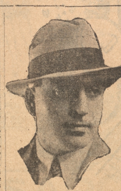
En la función de la tarde, el Cuadro Artístico "Victor Domingo Silva" estrenará la comedia en un

Para las funciones de tarde y noche de hoy el Teatro Rialto estrenará la extraordinaria superproducción titulada "Fascinación" cuyos intérpretes principales son Paul Lukas y Constance Cummings. Se trata de una obra realmente admirable en la que a la novedad de su argumento hay que agregar la buena interpretación que realizan los artistas que están a cargo de los roles principales. Por otra parte, hay que agregar el lujo que puede verse en trajes y escenarios de la cinta. En la matinee de esta tarde, el Rialto ofrece al público una función doble en cuya primera parte