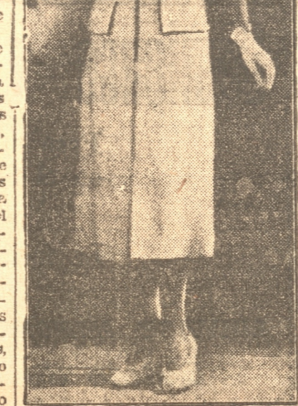
de 135.624.000 kilos. Como que con él han venido a crearse verdaderas novedades en materia de telas para vestidos, colgaduras, etc.

El juego completo, vestido, sombrero y zapatillas, forma parte de la Exhibición du Pont en el Museo Neoyorquino de Ciencias e Industrias, exhibición en la cual pueden verse muchos de los notables adelantos que ha logrado la industria química.