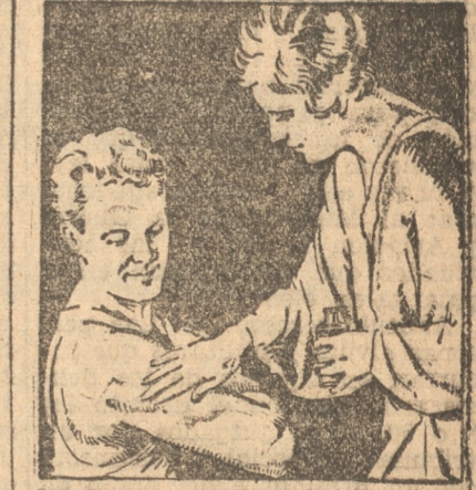
"Esa, eres maravillosa! Ese dolor al hombro no me molestará esta noche". "Dá gracias al SLOAN que alivia siempre los músculos doloridos".

Esta institución cita a su directorio para hoy viernes 29, a las 14 horas, en el local de la calle Elba